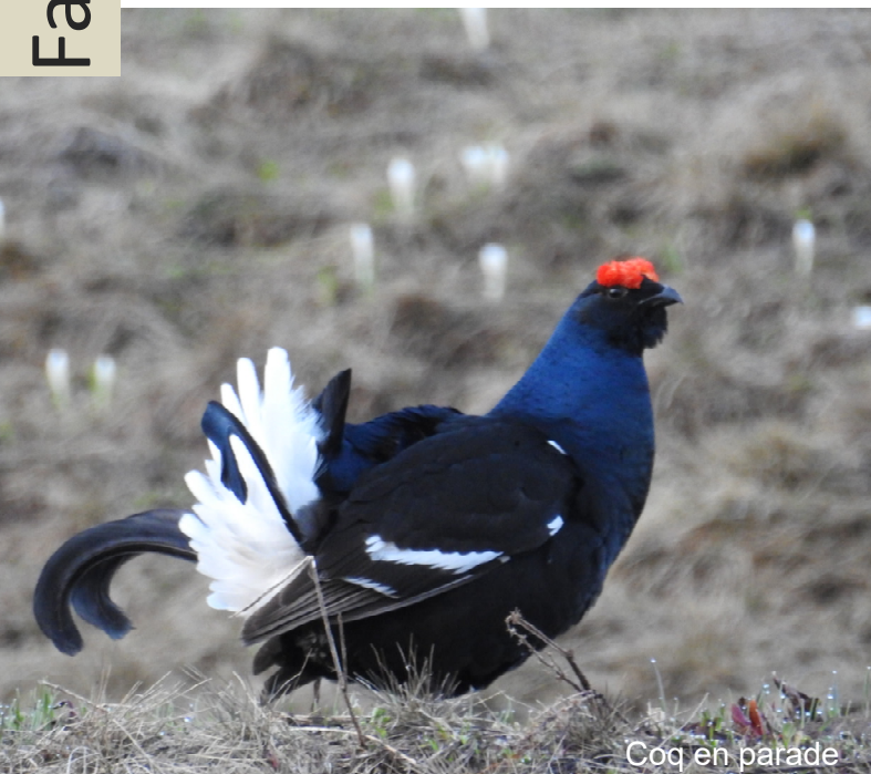
Coq en parade

Chez les tétras-lyres, le dimorphisme (différence morphologique du mâle et de la femelle d'une même espèce) marqué entre les deux sexes se révèle avant tout dans le plumage. Alors que le splendide plumage noir aux reflets bleutés des coqs est plutôt marquant, les poules portent toute l'année un plumage de camouflage gris-brun rayé.