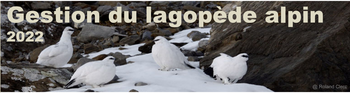
@ Roland Clerc