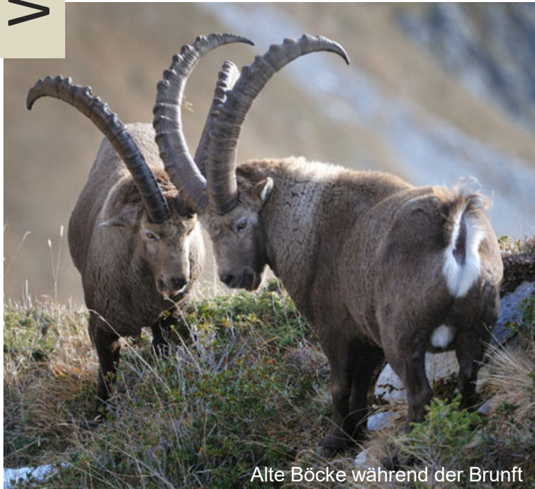
Alte Böcke während der Brunft

Die Steinböcke gehören wie die Gämsen zu den Hornträgern. Lebenslang werden die Hörner im Sommerhalbjahr ein paar Zentimeter nachgeschoben. Durch den Wachstumsunterbruch im Winter entstehen gut sichtbare Jahrringe (Einschnürungen) auf der Rückseite der Hörner, welche eine zuverlässige Altersbestimmung ermöglichen.