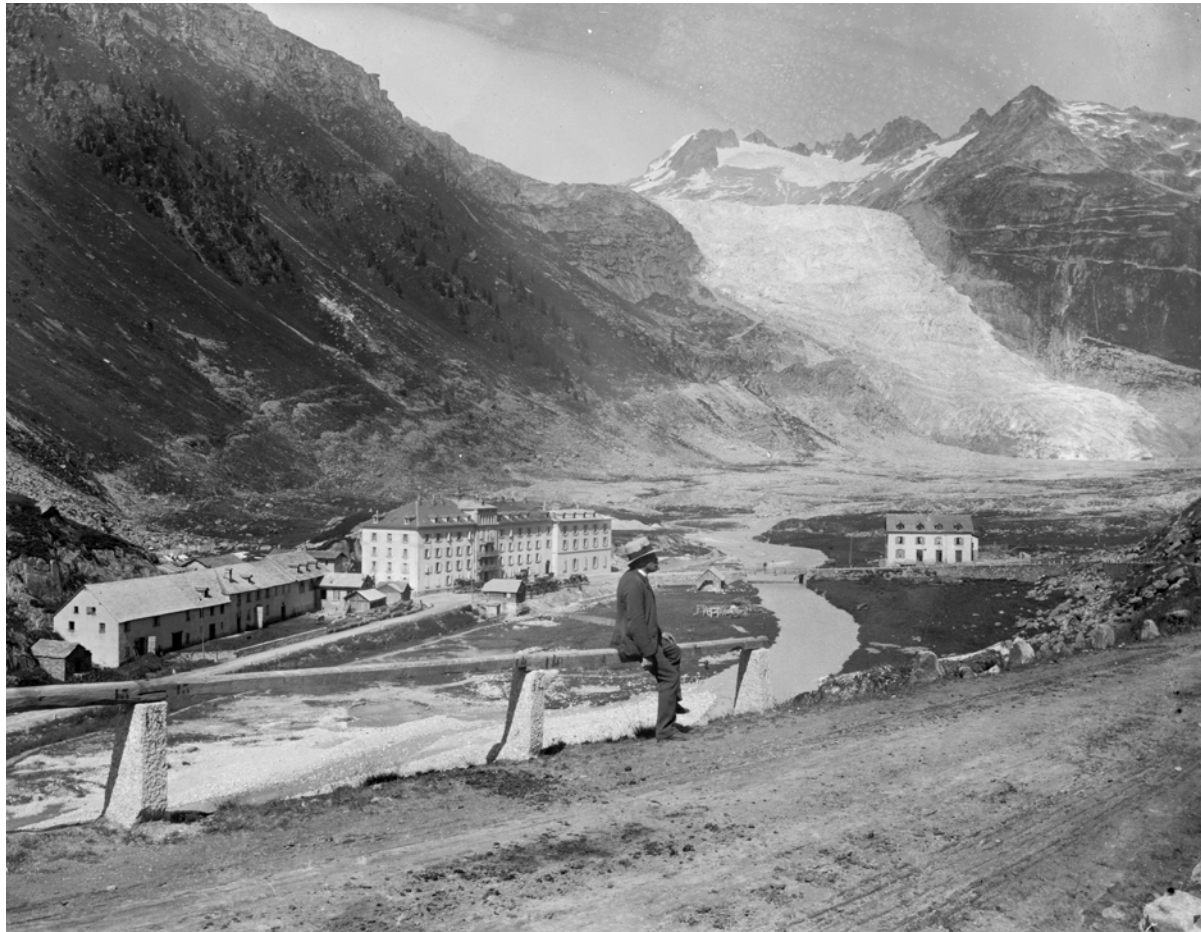
© André Schmid, Vue sur l'hôtel de Gletsch et le glacier du Rhône, 1891, coll. du Musée historique Lausanne

13 è m e colloque sur le RHÔNE dans son environnement naturel et humain