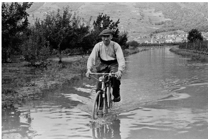
Charrat-Fully, 1948

Lehnen Sie sich bequem in ihrem Sessel zurück und lassen Sie sich auf die Spuren der Naturgefahren mitnehmen. Mit Erinnerung an die alpinen Risiken durchstreifen Sie audiovisuelle Archive, kommentiert mit dem Wissensstand von heute, zwischen Erinnerung an Katastrophen und Erläuterungen von Fachleuten. Folgen Sie dann dem Filmregisseur Maximilien Urfer und seinem philosophischen Märchen Aléalinéa , tauchen Sie mit ihm in die Vorstellungswelt der Naturgefahren ein und lassen Sie sich überraschen.