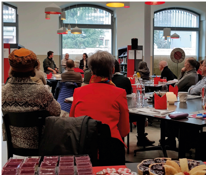
Déjeuner littéraire, Les Arsenaux

Agenda complet et détails des activités www.risques2018.ch