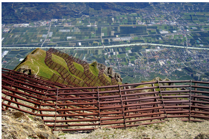
Grand Chavalard © Alexandre

Öffnen Sie die Tür zum Ausstellungszentrum Le Pénitencier und tauchen Sie mitten in die von Naturgefahren geprägte Welt der Alpen ein. Anhand eines originellen und lebendigen Parcours können Sie erfahren, wie die Menschen in den Alpen mit den Naturrisiken umgehen und welche Strategien entwickelt werden, um Katastrophen zu vermeiden. Machen Sie Bekanntschaft mit Fachleuten des Risikomanagements und hinterfragen Sie Ihr eigenes Verhalten gegenüber den heutigen und zukünftigen Risiken.