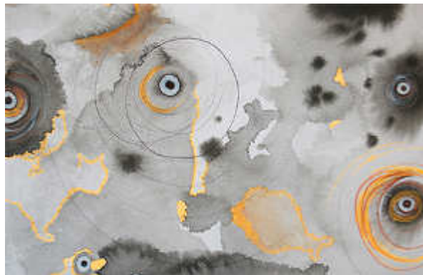
© Laetitia Salamin Oculaires , Mischtechniken auf Kartonpapier, 12 x 18 cm, 2016