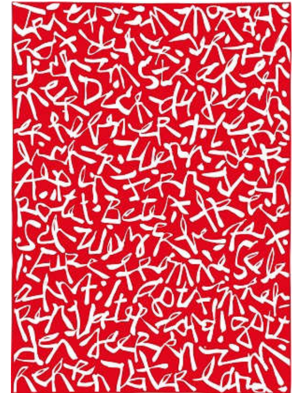
© Renato Jordan Schweizer Hymne : „Trittst im Morgenrot daher...“, Siebdruck, 42 x 30 cm, 2009