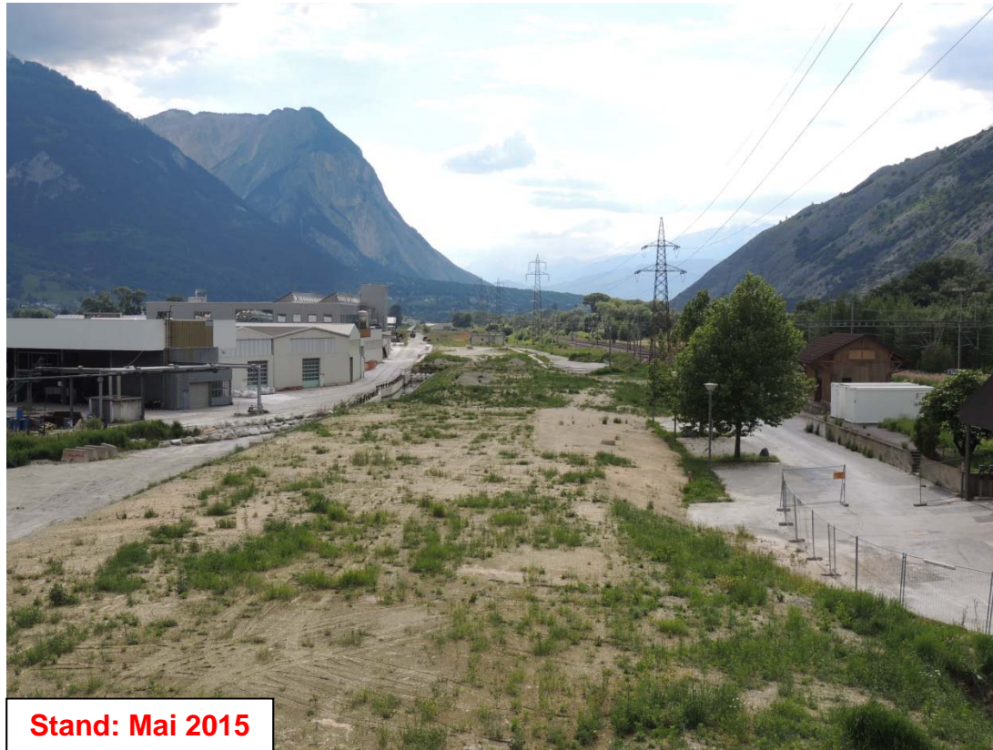
Stand: Mai 2015