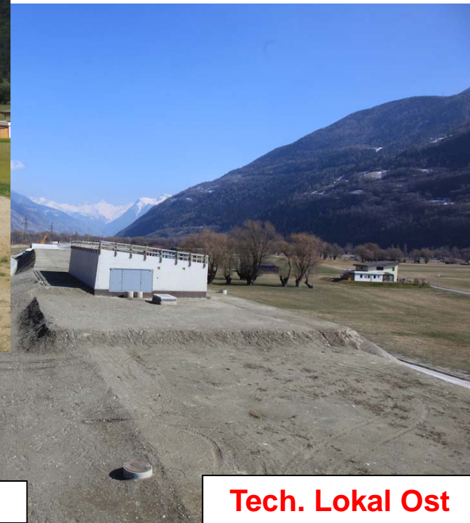
Stand: März 2015