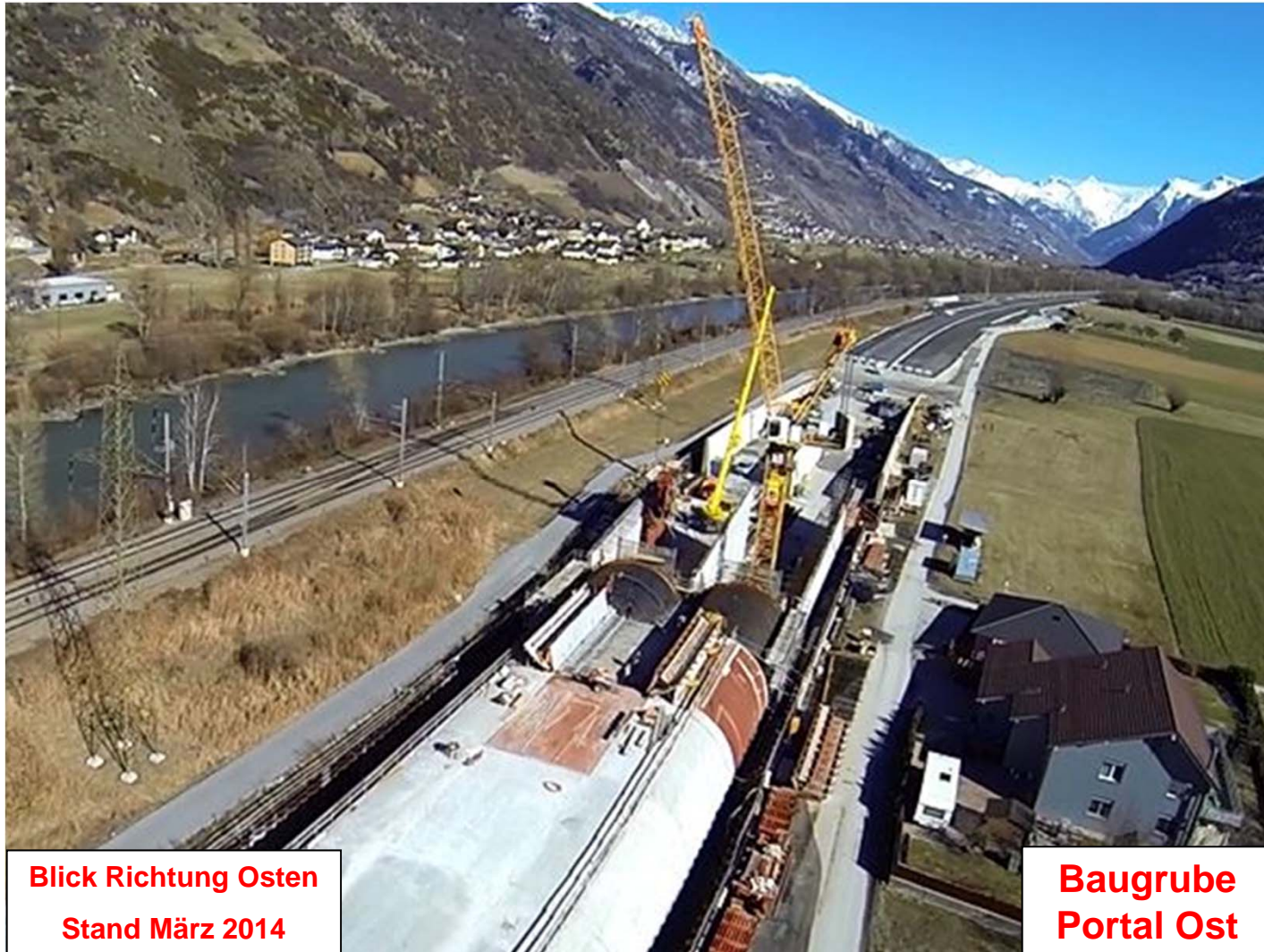
Blick Richtung Osten Stand März 2014