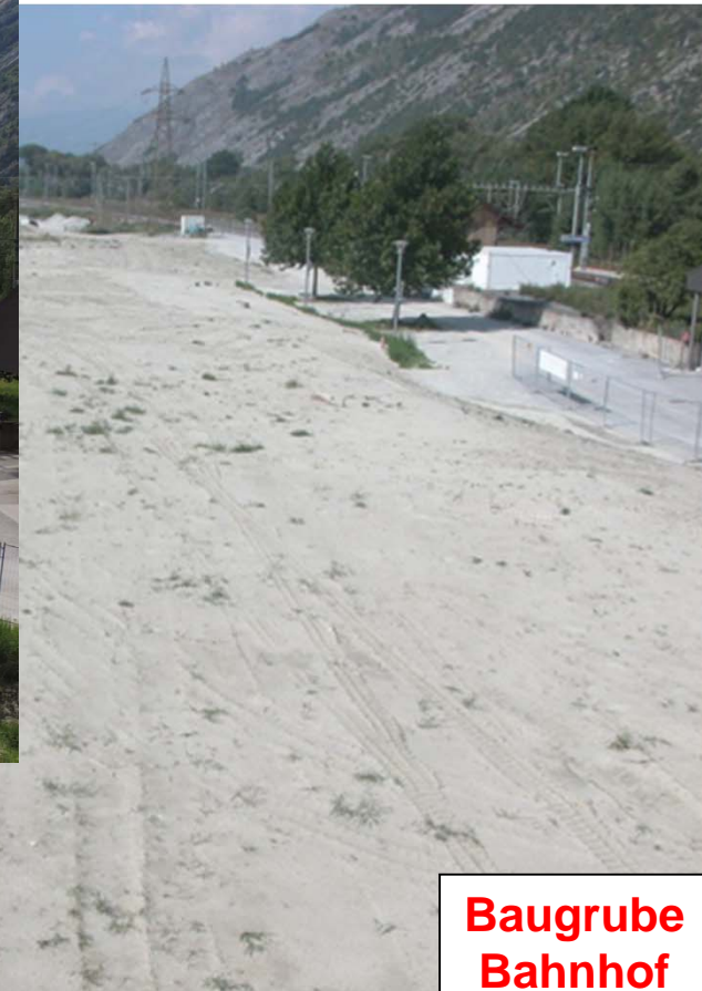
Stand: September 2014