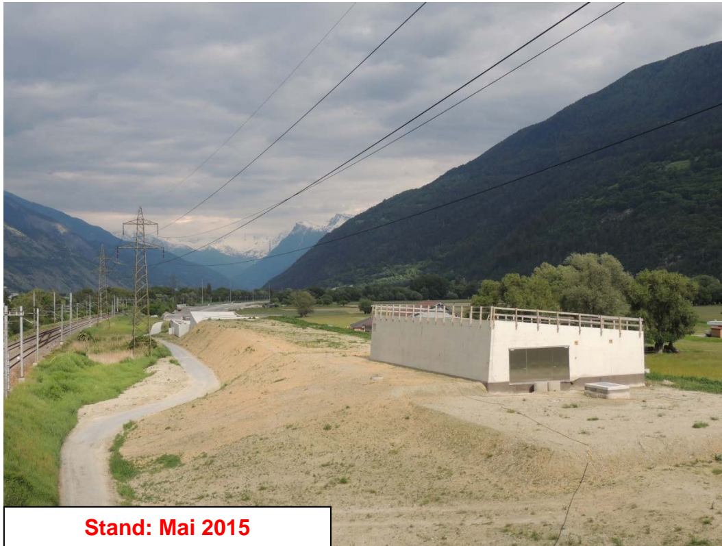
Stand: Mai 2015