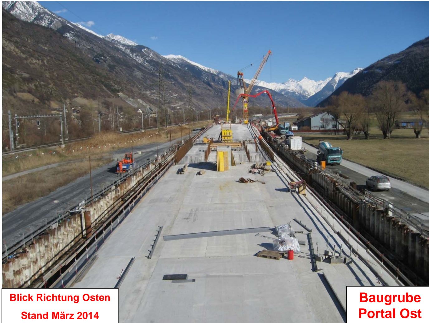
Blick Richtung Osten Stand März 2014