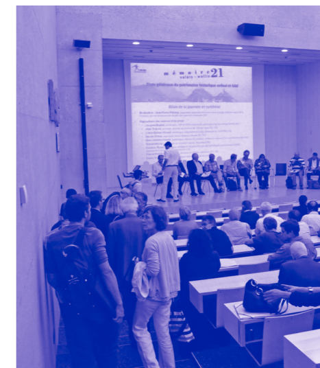
Mémoire 21 Valais-Wallis, Urs Mischler

— Grossratsaal rue du Grand-Pont 4, 1950 Sitten 10 – 12 Uhr, Do 28. April 2016 Präsentation und offizielle Übergabe der „Strategie Mémoire 21 Valais-Wallis“ 12 – 14 Uhr Stehlunch 14 – 16 Uhr „Dem Unvergänglichen auf der Spur“ Teilnahme gratis, Platzzahl beschränkt Anmeldung obligatorisch: www.memoire21.ch