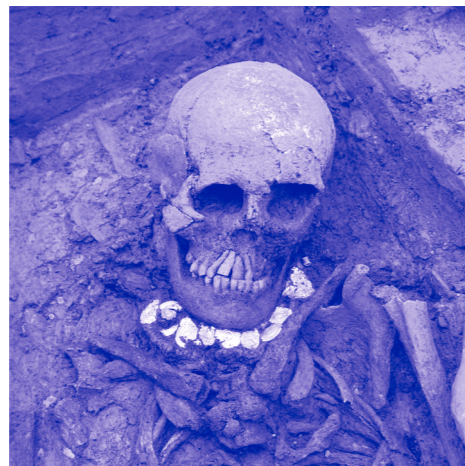
SBMA/ARIA SA, Sion

Im Rahmen des Projekts „Fundort des Monats“ laden Sie die Dienststelle für Hochbau, Denkmalpflege und Archäologie des Kantons Wallis und das Tourismusbüro Sion zu einem Rundgang durch die Walliser Kapitale ein, der Sie zu Grabstätten und Friedhöfen aus fast 7 Jahrtausenden führen wird, was in dieser Art und Dichte für die Schweiz einmalig ist! Dabei werden sich dem öffentlichen Publikum von Mitte April bis Ende August 2016 eine ganze Reihe von Fundstätten präsentieren.