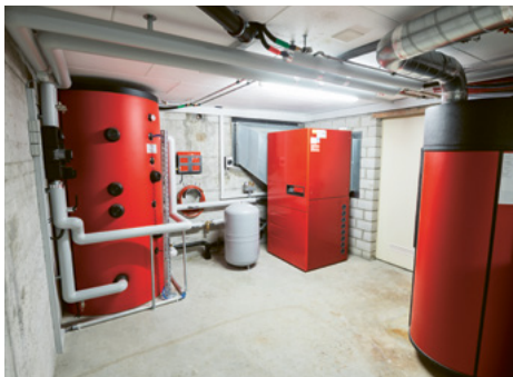
Ein Heizsystem mit erneuerbaren Energien reduziert den CO 2 -Ausstoss auf nahezu null.