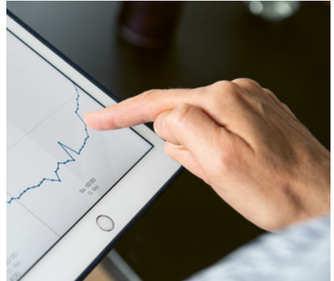
Eine energetische Sanierung steigert den Wohnkomfort.

Das Gebäudeprogramm von Bund und Kantonen fördert die energetische Erneuerung des Schweizer Gebäudeparks und trägt massgeblich zur CO 2 -Reduktion im Inland bei. Es unterstützt Liegenschaftseigentümerinnen und -eigentümer finanziell bei Massnahmen, die den Energieverbrauch und den CO 2 -Ausstoss von Liegenschaften verringern. Dazu zählen die Wärmedämmung der Gebäudehülle, der Ersatz fossiler oder elektrischer Heizungen durch Heizsysteme mit erneuerbaren Energien, der Anschluss an ein Wärmenetz sowie umfassende energetische Sanierungen und Neubauten im Minergie-P oder GEAK A/A Standard.