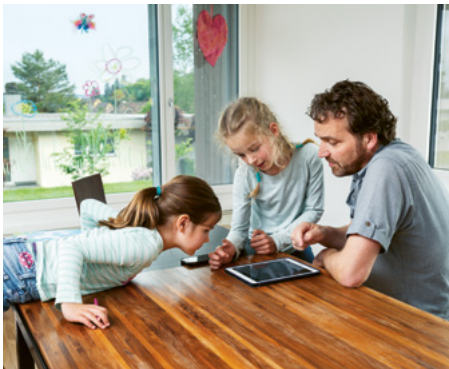
Die moderne Haustechnik lässt sich über ein Tablet steuern.