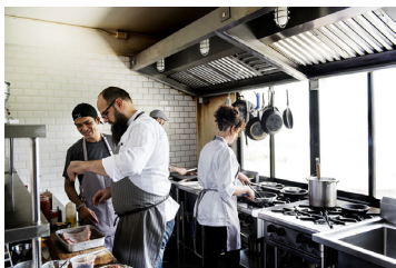
Formation pratique 3-4 jours en entreprise