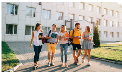
Formation théorique 1-2 jours à l'école professionnelle