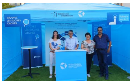
Stand Action Diabète 2021