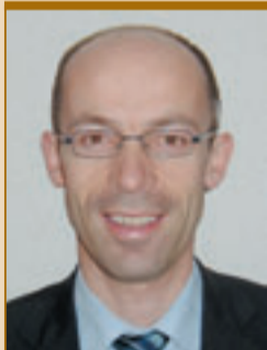
Gérald Dayer Chef du service de l'agriculture

L'agriculture suisse est soumise à une pression économique grandissante, principalement due à l'ouverture du marché et aux accords de libre-échange. Pour permettre aux exploitations agricoles de la plaine du Rhône de rester concurrentielles sur le marché agricole, il s'agit en premier lieu de préserver la surface agricole face à l'expansion des zones à bâtir et à la construction des infrastructures publiques, y compris le projet de 3 e correction du Rhône. En second lieu, il s'agit de prévoir une amélioration des équipements agricoles et des structures foncières.