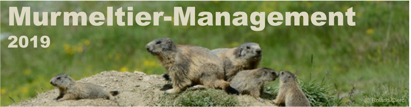
@ Roland Clerc