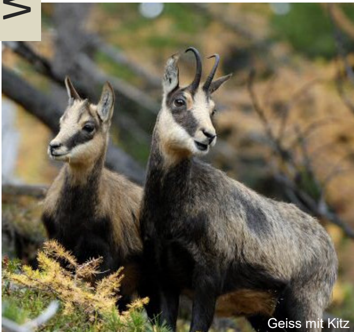
Geiss mit Kitz

Die Gämse ist die häufigste Wildhufttierart im Wallis. In einzelnen Regionen sind die Gamsbestände und -jagdstrecken wie vielerorts im gesamten Alpenraum rückläufig. Die Summe mehrerer Faktoren scheint dafür verantwortlich zu sein. Die Lebensraumqualität (gute Nahrung, ruhige Einstände), harte Winter, Störung durch Freizeitaktivitäten, interspezifische Konkurrenz durch Nutztiere und Wildtiere, aber auch Krankheiten und Grossraubtiere beeinflussen diese sensible Wildart. Entscheidend hinzu kommt der Jagddruck in bejagten Populationen. Rückläufige Bestände, auch in unbejagten Gebieten, zeigen jedoch, dass die Jagd nicht der einzig relevante Faktor sein kann.