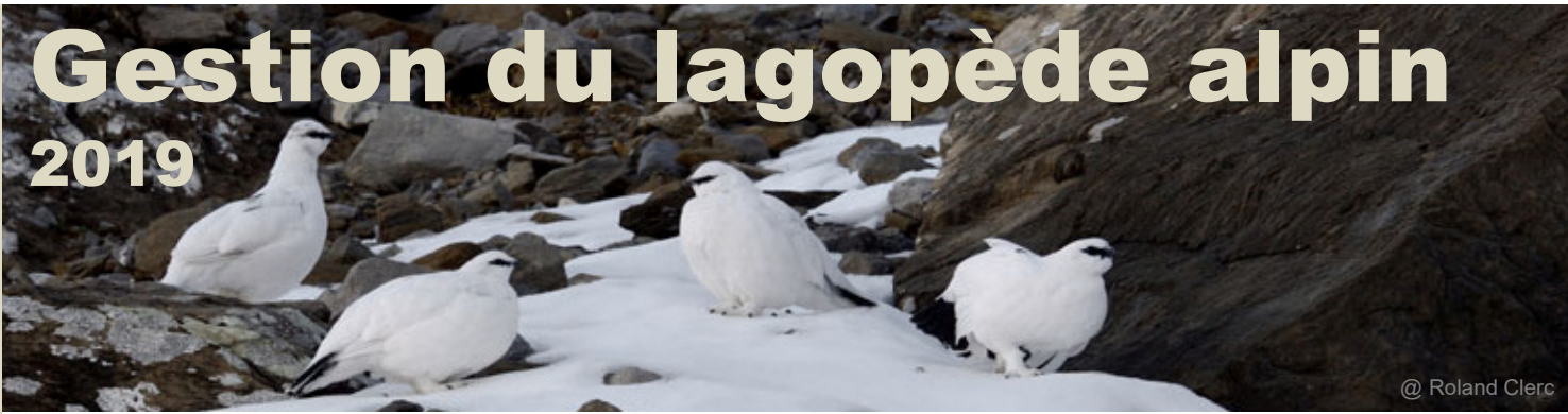
@ Roland Clerc