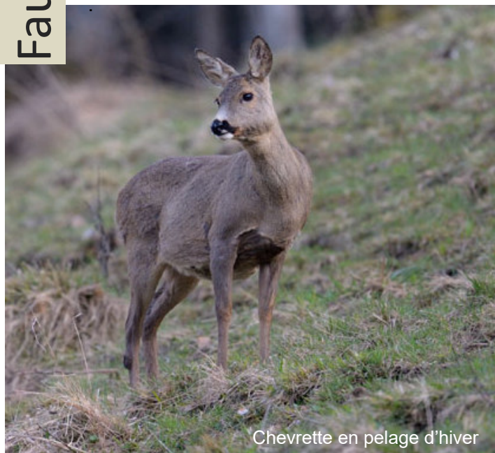
Chevrette en pelage d'hiver

Le chevreuil n'est pas un coureur endurant, mais en cas de danger il se glisse à couvert. Son arrière-train surélevé est parfaitement adapté à ce comportement. Une caractéristique propre au chevreuil: lorsqu'il est poursuivi, il tente de se défaire de son poursuivant en fuyant en zigzag et en revenant sur ses pas en sautant.