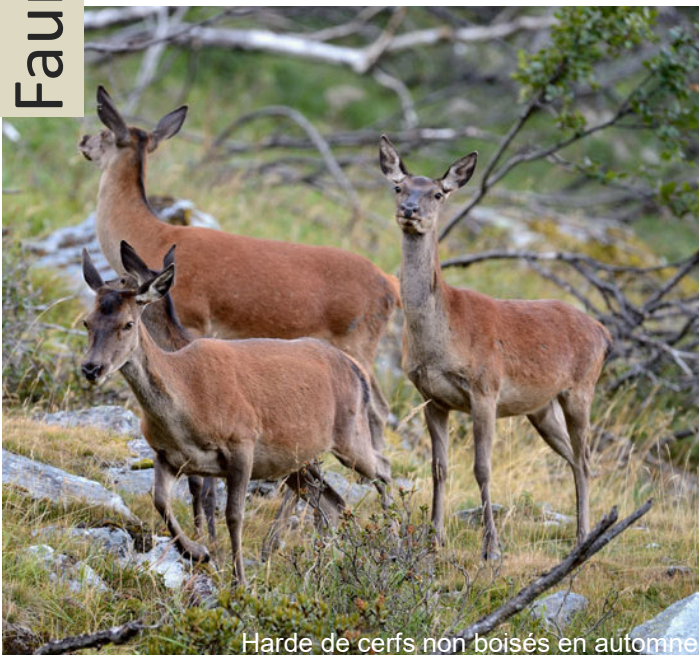
Harde de cerfs non boisés en automne

Dans les régions enneigées du Valais, le cerf élaphe migre chaque année des remises d'été en altitude vers les remises d'hiver situées plus bas. Le cerf élaphe se concentre alors souvent dans quelques remises d'hiver appropriées, en particulier sur des pentes ensoleillées exposées au sud avec des prairies où la neige fond rapidement, et dans les forêts protectrices.