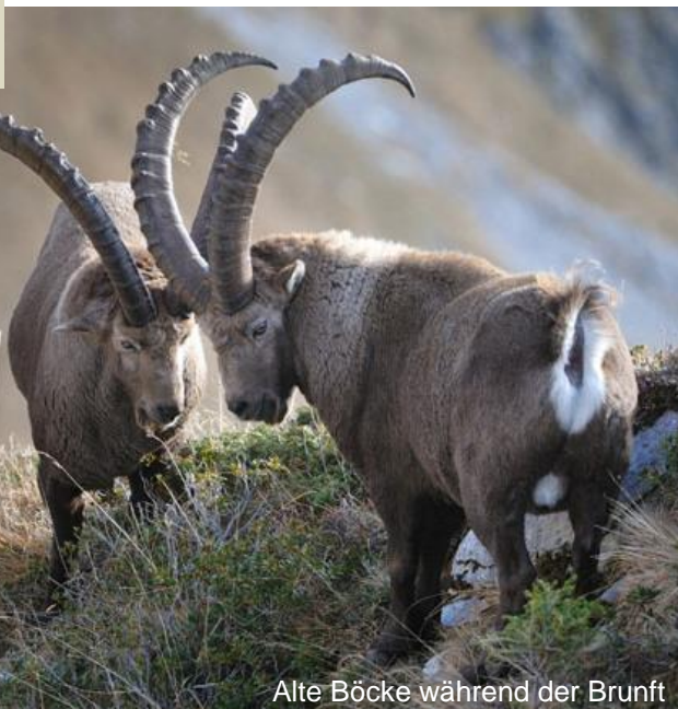
Alte Böcke während der Brunft

Die Steinböcke gehören wie die Gämsen zu den Hornträgern. Lebenslang werden die Hörner im Sommerhalbjahr ein paar Zentimeter nachgeschoben. Durch den Wachstumsunterbruch im Winter entstehen gut sichtbare Jahrringe (Einschnürungen) auf der Rückseite der Hörner, welche eine zuverlässige Altersbestimmung ermöglichen.