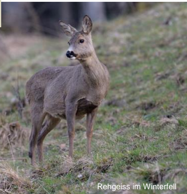
Rehgeiss im Winterfell

Das Reh ist kein ausdauernder Läufer, sondern schlüpft bei Gefahr in Deckung (Schlüpfertyp). Der hinten erhöhte Körperbau ist optimal an dieses Verhalten angepasst. Typisch für flüchtendes Rehwild sind zudem sogenannte Widergänge (Zurückkehren in der eigenen Fährte mit seitlichem Abspringen) um den Verfolger abzuschütteln.