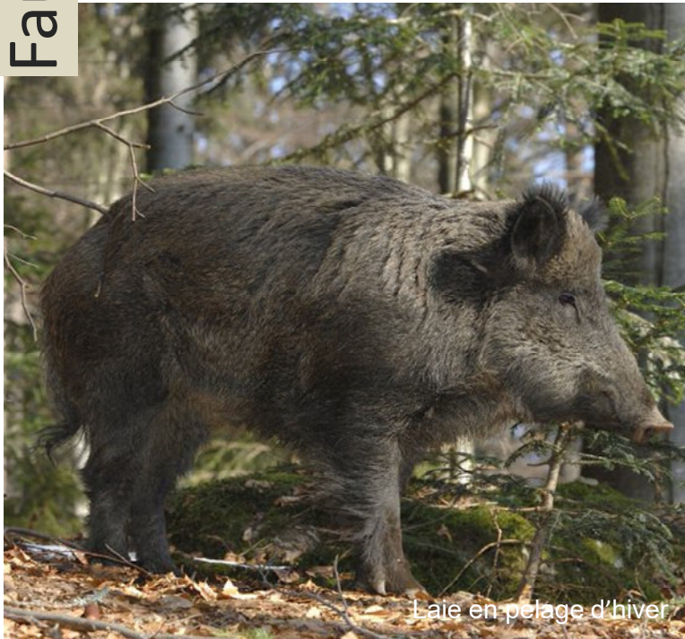
Laie en pelage d'hiver

Le sanglier est l'ongulé le plus secret du Valais. En sa qualité d'hémérophile d'une grande mobilité, au spectre alimentaire extrêmement varié et doté d'un énorme potentiel de reproduction, cette espèce est en progression dans de nombreuses régions. En raison de son comportement secret, il est très rare d'observer des sangliers, en particulier durant la journée. Bien qu'ils soient par nature actifs durant la journée et au crépuscule, les fréquents dérangements et la pression due à la chasse les poussent à s'activer presque exclusivement la nuit. En journée, les sangliers se reposent souvent dans des fourrés et ne sortent qu'à la tombée de la nuit en quête de nourriture. Le sanglier est omnivore et sa nourriture très variée est principalement constituée de végétaux.