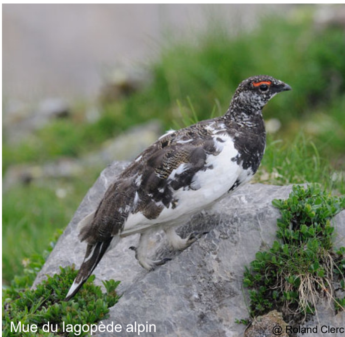
Mue du lagopède alpin