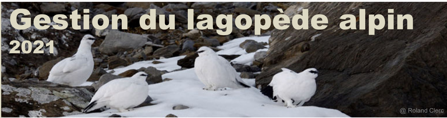
@ Roland Clerc