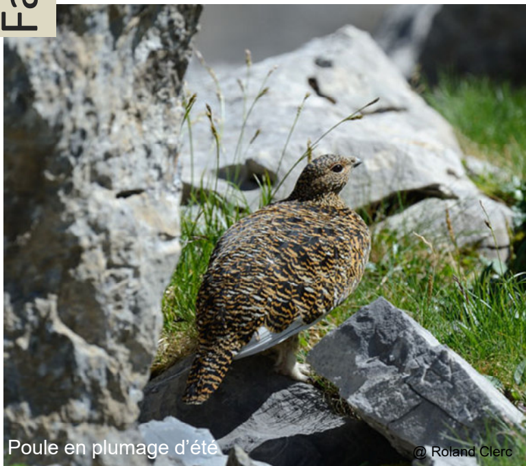
Poule en plumage d'été