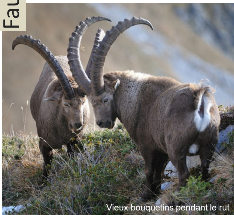
Vieux bouquetins pendant le rut

Les bouquetins, comme les chamois, appartiennent à la famille des bovidés. Tout au long de leur vie, leurs cornes poussent de quelques centimètres durant la période d'été. L'interruption de la croissance en hiver entraîne l'apparition des anneaux de croissance (stries annuelles) sur l'arrière des cornes; ceux-ci permettent de déterminer leur âge avec précision.