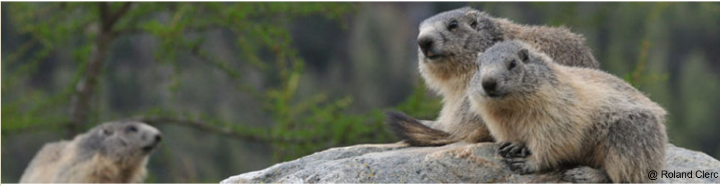
@ Roland Clerc