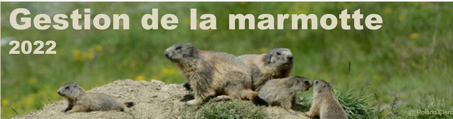
@ Roland Clerc