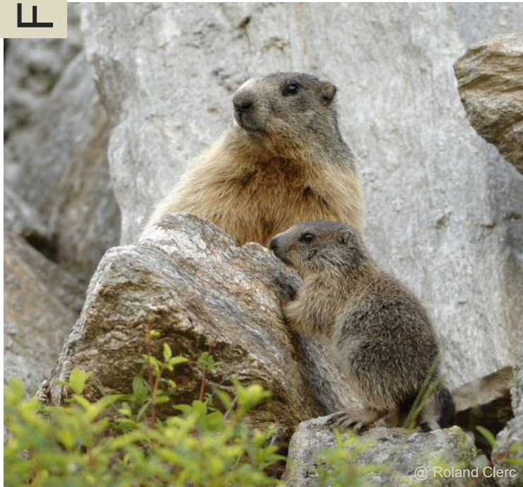
@ Roland Clerc

Les marmottes mâles et femelles sont presque identiques et se distinguent à peine à distance. Les mâles sont néanmoins en principe un peu plus grands et plus lourds. Les femelles allaitantes peuvent parfois être reconnues grâce à leurs mamelles. Leur poids varie fortement au cours de l'année. Les épaules musclées et fortes et les pattes munies de grosses griffes sont frappantes chez la marmotte.