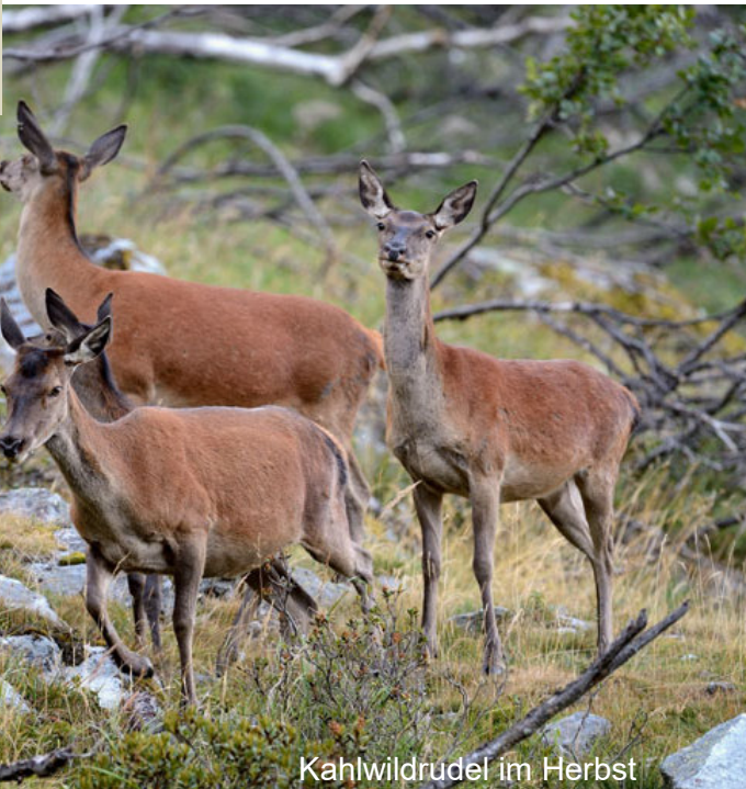
Kahlwildrudel im Herbst

Der Rothirsch ist die grösste Wildhufttierart im Wallis. Rothirsche leben in Rudeln, die ausser zur Brunftzeit fast ganzjährig nach Geschlechtern getrennt sind. Zwei Faktoren beeinflussen die regionale Verbreitung massgeblich: Schutz vor menschlicher Störung und ausreichend Nahrung. In den schneereichen Regionen des Wallis wandert der Rothirsch alljährlich von hoch gelegenen Sommereinständen hinunter in die tiefer gelegenen Wintereinstände. Das Rotwild konzentriert sich dann oft in wenigen geeigneten Wintereinständen, meist an sonnenexponierten Südhängen mit schnell ausapernden Wiesen und schützendem Wald.