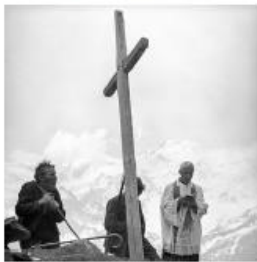
Croix en bois sur la neige au Val de Rhodé, 1941