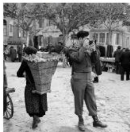
Un soldat allemand photographié le matin de Noël, 1945