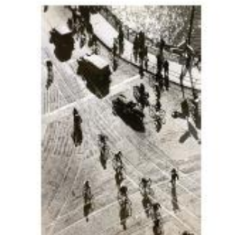
Scènes dans le pays, journal de la 5 e Internationale, 1947 © Max Kettel, Musée d'histoire de la Suisse - Martigny