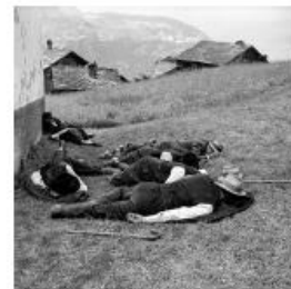
Scènes dans le pays, journal de la 5 e Internationale, 1947