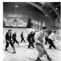
Photo de ski effectuée au Compagnon suisse de Leysin, 1938-39