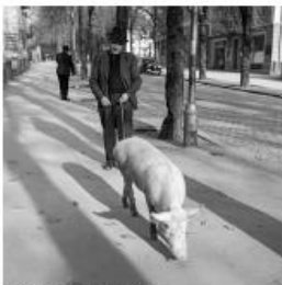
Photo au Métro sur la neige de la Place, 1943