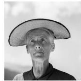
St. Charles, 1942