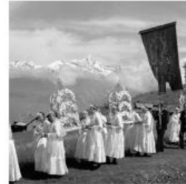
Fête Dieu, Valais, 1942