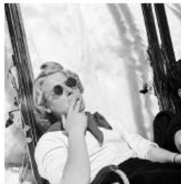
St. Charles, 1942