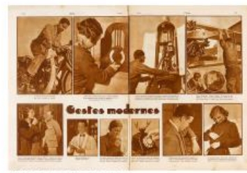
Max Kettel, «Cinéma d'histoire», L'Œuvre, 18 novembre 1933