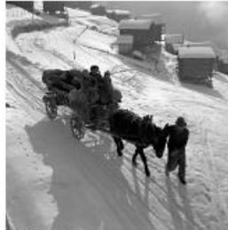
Rochdale, 1847-1848, 1841