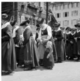
Procession de la Fête Dieu, Lucerne, 1933