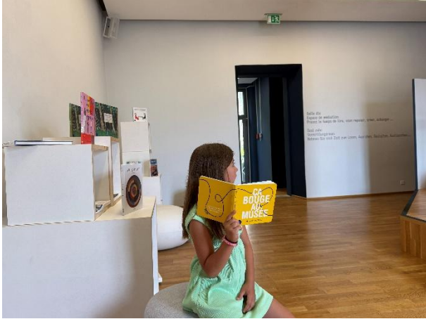
Saal zehn.

Der Saal zehn ist ein Ort zum Lesen, Diskutieren, Schreiben, Spielen und Zeichnen zugleich. In diesem Jahr dient er zudem, um Kontakte zu vergangenen und künftigen Besuchenden zu fördern. Diese partizipative Einrichtung wurde von der Gastkünstlerin Marie Jambers konzipiert.