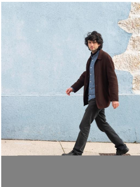
© 2026 Pro Litteris, Zurich. Andriu Deplazes

Andriu Deplazes (Zurich/CH, *1993) a étudié à la ZHdK – Zürcher Hochschule der Künste (2012-2016), avec une année à la LUCA School of Arts, Bruxelles (2015-2016). Il expose régulièrement en Suisse et en Europe. Il a reçu plusieurs prix, dont le Helvetia Art Prize en 2017 et Manor Kunstpreis Graubünden en 2019. Il vit et travaille entre Marseille, Paris et Zurich.