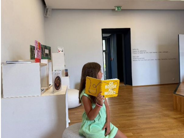
Salle dix.