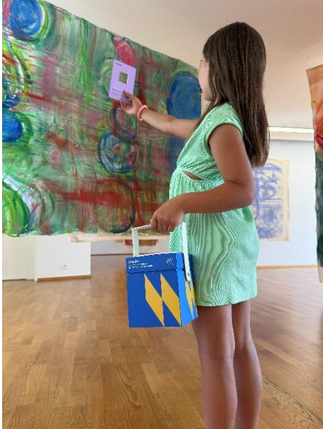
Coffret Inspiro .

Le coffret Inspiro est truffé de propositions pour affiner son observation, donner la parole à son imagination ou mettre son corps en jeu tout au long de l'exposition. Avec ses cartes colorées, il s'adresse aux familles, mais aussi à toutes les personnes qui souhaitent placer leur visite sous le signe de l'imprévu, du hasard et de l'échange. Disponible gratuitement à l'accueil du musée.