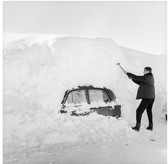
Voiture enfouie sous la neige à Chandolin, 6 janvier 1966