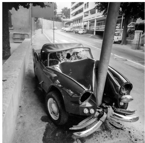
Voiture contre un réverbère, 2 blessés, Sion, 30 juillet 1966