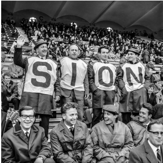
Sion-Servette, première victoire de Sion en coupe de Suisse, Berne, 19 avril 1965