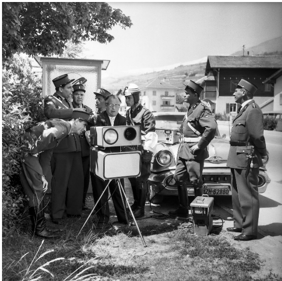
Nouvel appareil radar, Sion, 4 juin 1962