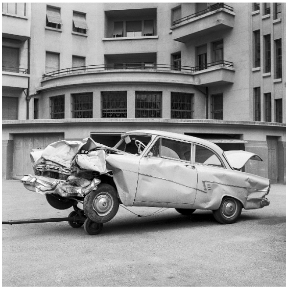
Collision entre deux automobiles, Sion, 19 juillet 1960