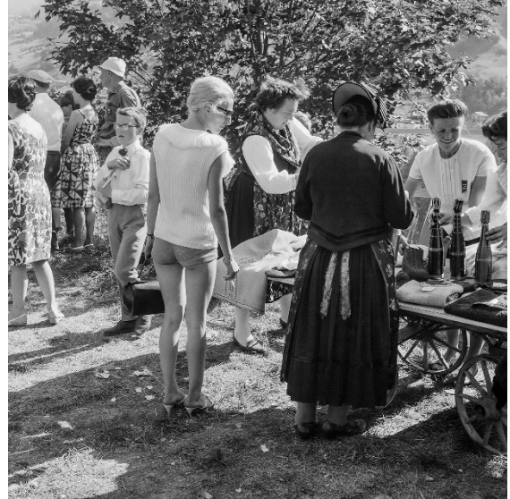
Cortège de la mi-été, Vissoie, 14 août 1966