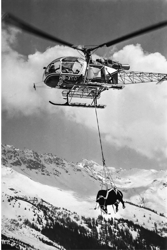
Transport par hélicoptère de vaches bloquées à l'alpage de la Chaux, Verbier, 20 avril 1975