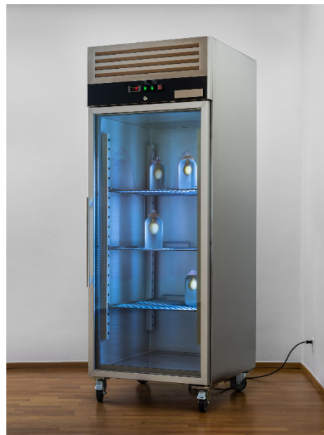
Nature marâtre , 2023 Congélateur et 4 flacons en verre massif, contenant du lait maternel ©Aurélie Strumans.