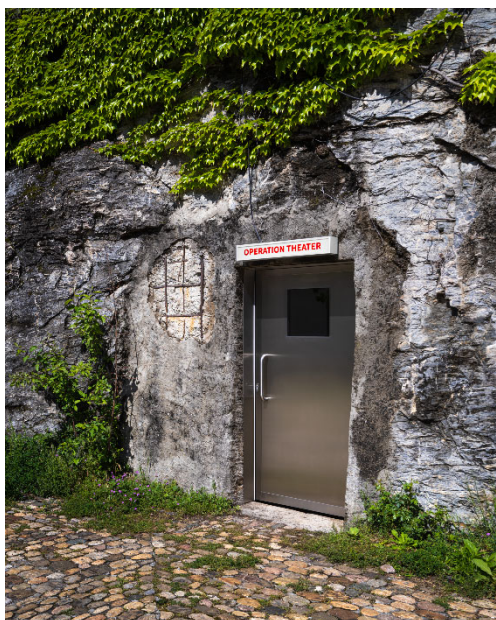
Théâtre (Dans le ventre de la Terre, dans le ventre de la mère) , 2023 Enseigne lumineuse, porte en inox avec hublot carré, barre télescopique en inox, rideau, spot LED et alimentation électrique ©Aurélie Strumans.