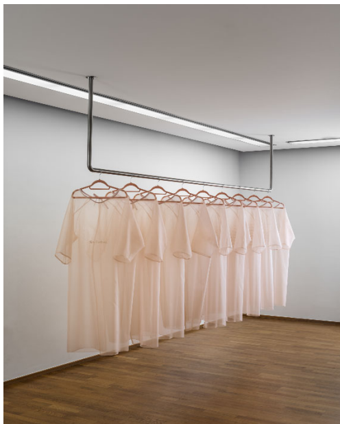
Chair Docteurs , 2023 9 robes en organza de soie avec broderies en fil de coton, cintres en velours et barre en inox ©Aurélie Strumans. Photo : Musées cantonaux du Valais, Sion. Olivier Lovey.

> à télécharger sur vs.ch/culture/infos-medias