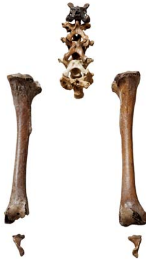
Os de dodo, Musée cantonal de géologie, Lausanne Devenu personnage de divertissement pour les enfants (Alice au pays des merveilles, dodu dodo diffusé sur la Télévision suisse romande dans les années 80 ou l'Âge de Glace), le dodo est une espèce qui disparut de l'île Maurice moins d'un siècle après l'arrivée des colons européens au XVIème.