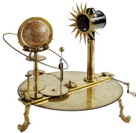
Tellurium, Musée d'histoire des sciences de la Ville de Genève Durant la modernité se développe l'idée d'un monde mécanique, régi par des lois mathématiques et universelles.