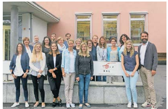
Informationen und Fachauskünfte erhalten Interessierte im Berufsinformationszentrum (BIZ).