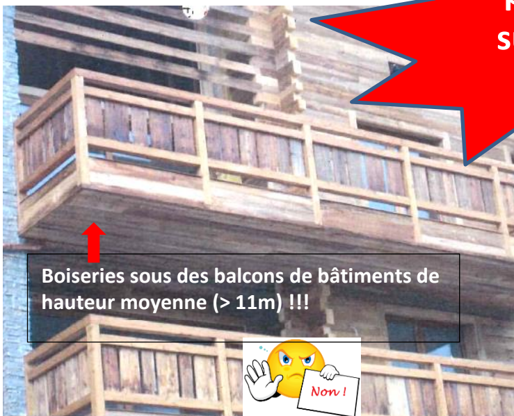
Boiseries sous des balcons de bâtiments de hauteur moyenne (> 11m) !!!

Uniquement placage 1,5 mm sur panneau RF1