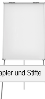
Flip Chart, Papier und Stifte