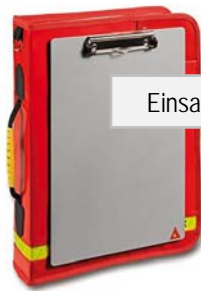
Einsatzleitermappe mit den offiziellen Unterlagen

Ist eine minimale Einrichtung und Ausrüstung für die Einsatzführung eines grösseren Ereignisses vorhanden.