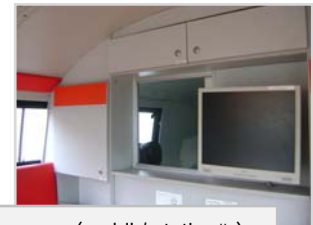
Definierter Führungsraum (mobil / stationär)