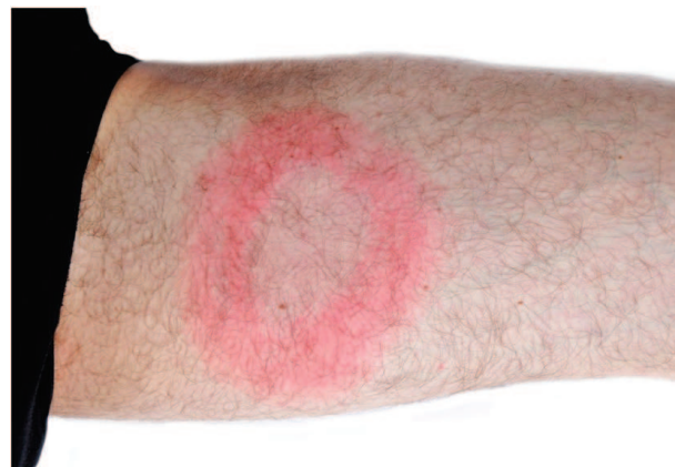
Figure 2 : Erythème migrant typique sur la cuisse.

Dans la phase précoce de la maladie (jours-semaines après la piqûre), environ la moitié des patients développent un érythème migrant typique (Figure 2), parfois accompagné de fièvre. Dans une deuxième phase (semaines-mois après la piqûre), des symptômes articulaires, neurologiques (parésies faciales, paresthésie) ou cardiaques peuvent apparaître. D'autres symptômes ne se manifestent que des mois voire des années après l'infection (acrodermatite atrophiante, autres symptômes neurologiques,...).