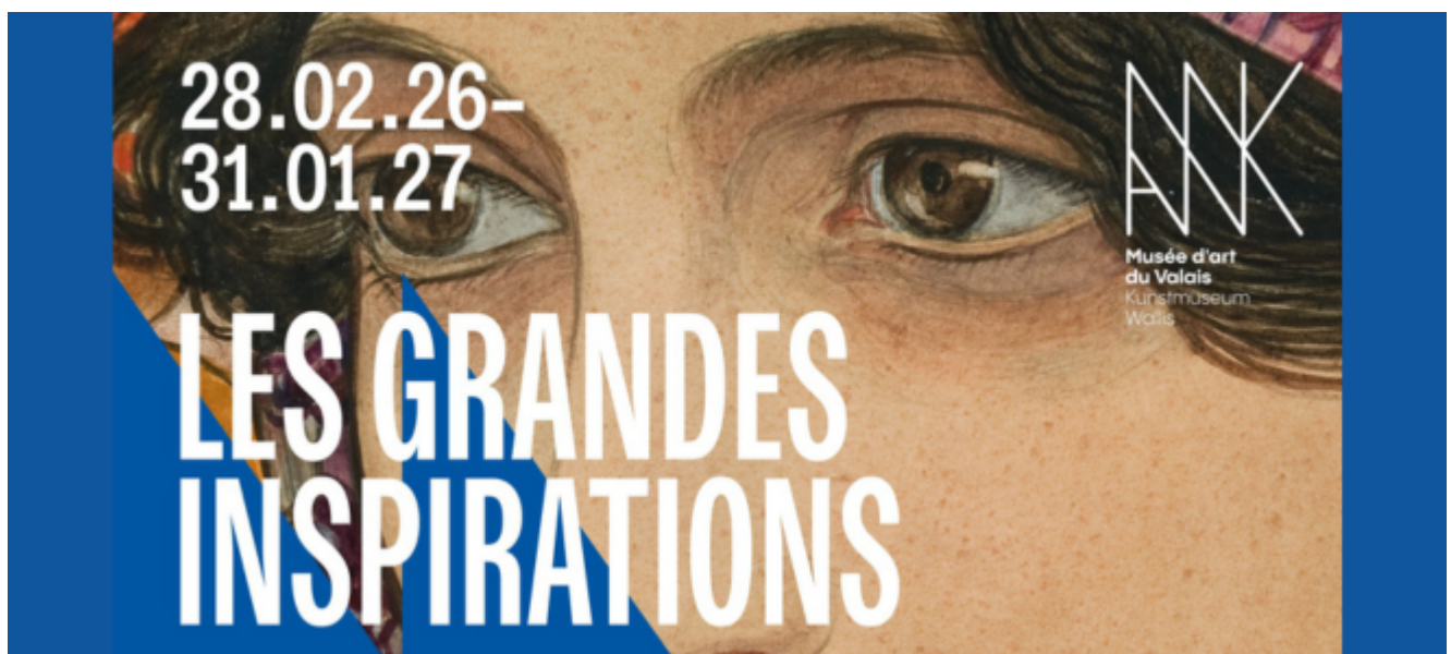
Détail de l'affiche du cycle d'expositions Les grandes inspirations au Musée d'art du Valais

Les fouilles sont présentées au public tous les mercredis après-midi dès 15h00. Alors, venez nombreux découvrir ces trésors qui dorment sous la ville moderne !