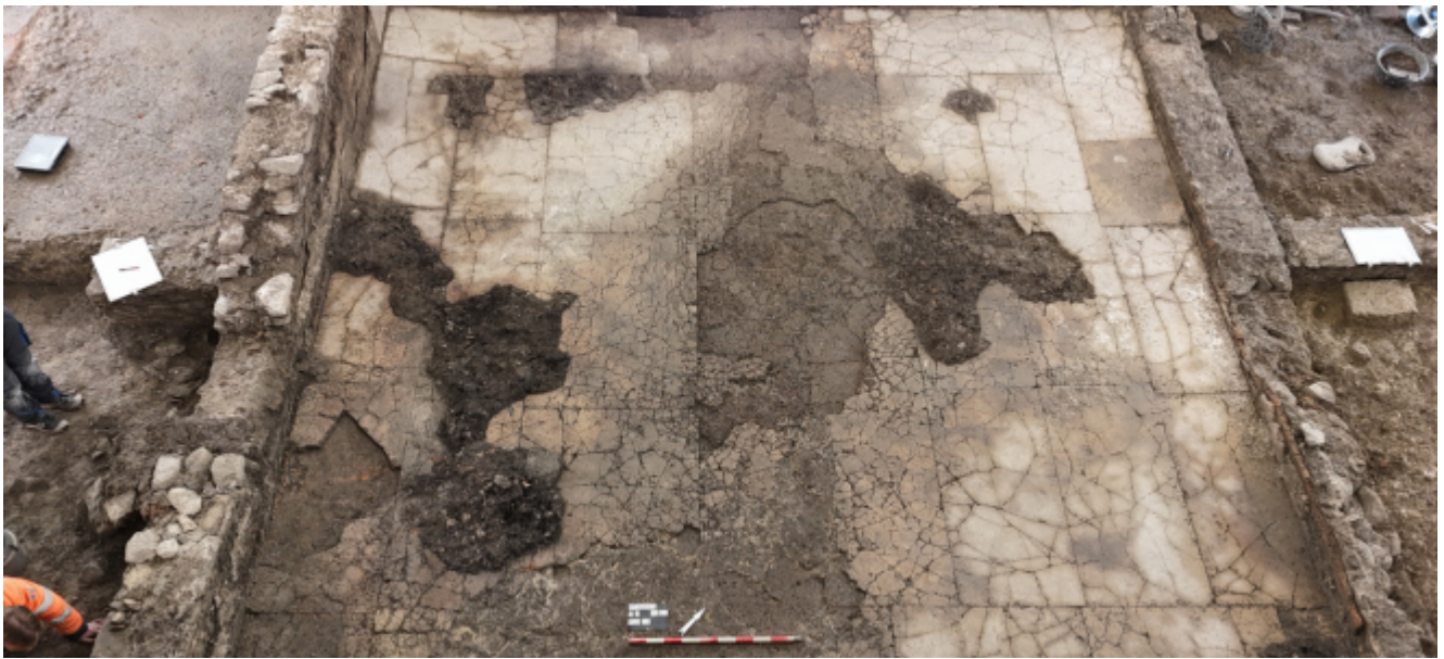
Salle d'apparat d'une superficie de 50 m 2 et revêtue d'un dallage en marbre.