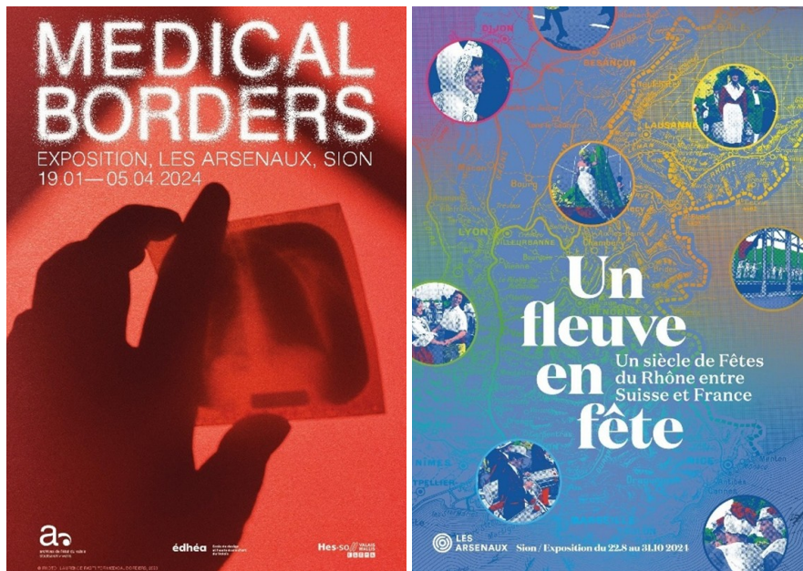
FIGURE 3 – Visuels des expositions Medical Borders (EDHEA) et Un fleuve en fête .