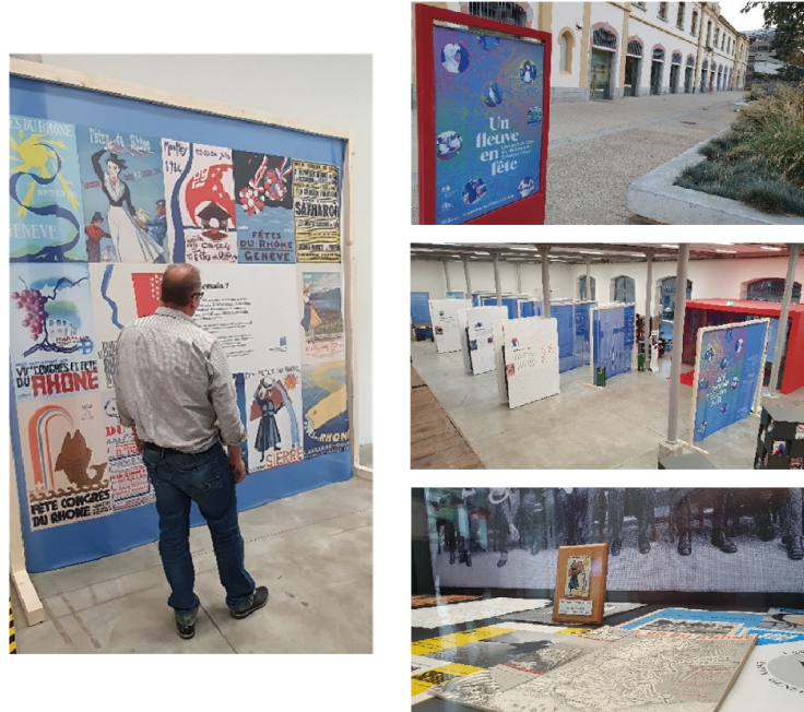
FIGURE 2 – Impressions de l'exposition Un fleuve en fête .