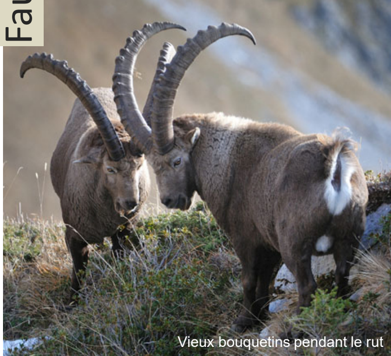
Vieux bouquetins pendant le rut

Les bouquetins, comme les chamois, appartiennent à la famille des bovidés. Tout au long de leur vie, leurs cornes poussent de quelques centimètres durant la période d'été. L'interruption de la croissance en hiver entraîne l'apparition des anneaux de croissance (stries annuelles) sur l'arrière des cornes; ceux-ci permettent de déterminer leur âge avec précision.