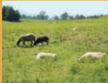
Auf dieser Weide fehlt Schatten.