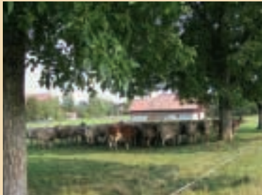
Ist es Kühen zu heiss, geht die Milchleistung zurück.