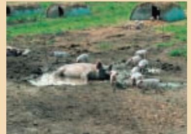
Les porcs ont besoin d'une souille en été.

nence regagner leur abri. Ces derniers doivent être bien fournis en litière.