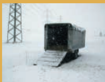
Il est facile de mettre un abri mobile à disposition des petits troupeaux de moutons.