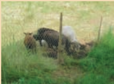
En cas de forte chaleur, les moutons ont absolument besoin d'ombre.