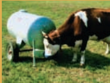
Les abreuvoirs mobiles proposent de l'eau propre en tout temps.

Lors de fortes chaleurs, les animaux doivent disposer en permanence d'eau propre.