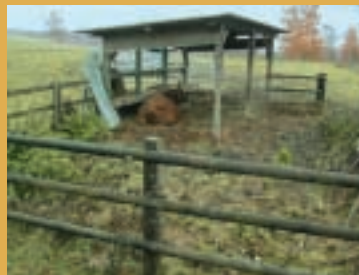
En cas de forte chaleur, l'abri doit être le plus ouvert possible.