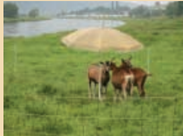
Les chèvres ne veulent en aucun cas se mouiller.