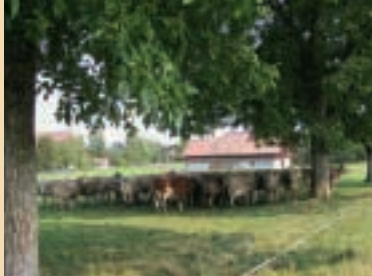
Si les vaches ont trop chaud, leur production laitière diminue.