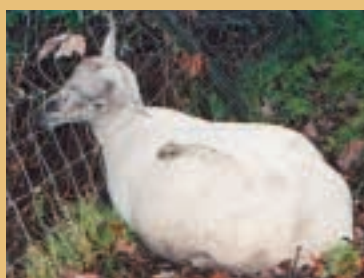
Ce mouton s'est empêtré dans une clôture. Un contrôle journalier permet de le libérer à temps.