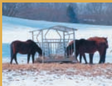
Dans un râtelier couvert, le fourrage reste sec et propre.