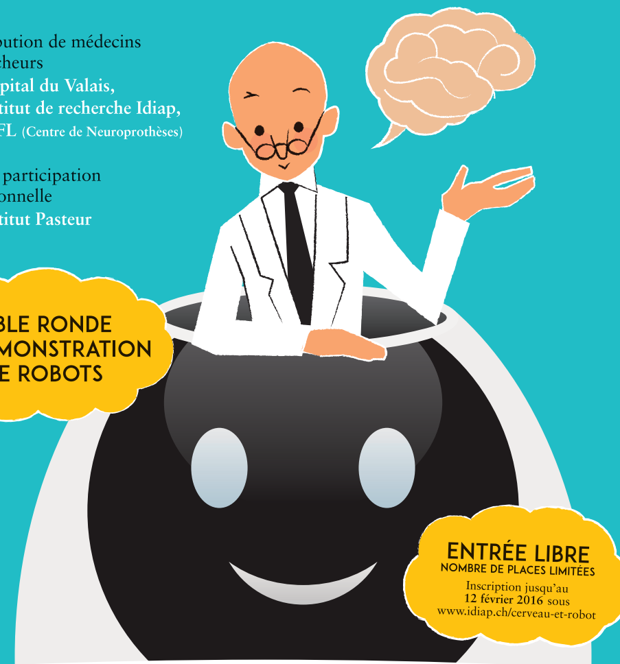
TABLE RONDE ET DÉMONSTRATION DE ROBOTS

ENTRÉE LIBRE NOMBRE DE PLACES LIMITÉES Inscription jusqu'au 12 février 2016 sous www.idiap.ch/cerveau-et-robot