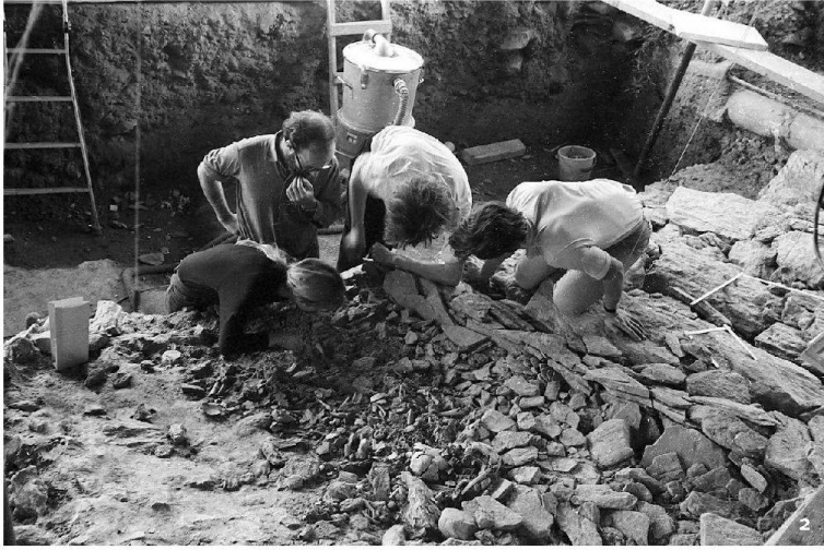
Fig. 2 Sion, Petit-Chasseur I, 1971. Déga- gement d'un amas d'os humains brûlés déposés dans une fosse le long du soubassement du dolmen M VI.

Sion, Petit-Chasseur I, 1971. Freilegen einer Ansammlung verbrannter menschlicher Knochen, die in einem Graben längs des Fundaments von Dolmen M VI zum Vorschein kamen.