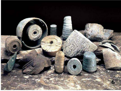
Fig. 6 Zermatt-Furi (VS). Déchets de fabrication de vases en pierre ollaire (atelier d'époque romaine).

Zermatt-Furi (VS). Scarti della produzione di recipienti in pietra ollare (officina d'epoca romana).