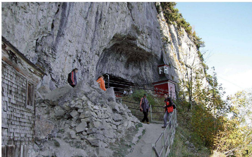
Fig. 3 Le site paléolithique du Wildkirchli (AI). Il sito paleolitico di Wildkirchli (AI).

Après des débuts très prometteurs au cours du premier tiers du 20 e siècle, la recherche va quelque peu diminuer dans les massifs et se concentrer sur le Plateau suisse; ici, les découvertes s'accroissent au fil des constructions à un rythme beaucoup plus soutenu que dans les Alpes.