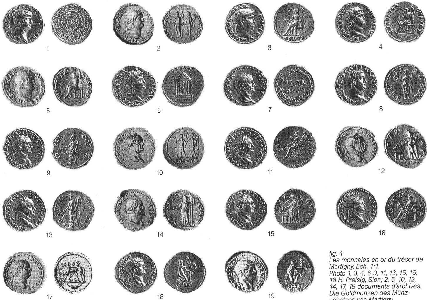
fig. 4 Les monnaies en or du trésor de Martigny. Ech. 1:1. Photo 1, 3, 4, 6-9, 11, 13, 15, 16, 18 H. Preisig, Sion; 2, 5, 10, 12, 14, 17, 19 documents d'archives. Die Goldmünzen des Münzschatzes von Martigny. Le monete del tesoro di aurei di Martigny.

19 Domitien César (sous Vespasien), Rome, 77-78 après J.-C., aureus .