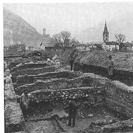
fig. 3 Fouille des boutiques de l'aile nord-est du forum de Martigny/ Forum Claudii Vallensium, du sud-est (début février 1897). Au premier plan, la boutique no. 40. Ausgrabung der Ladenlokale im Nordostflügel des Forums von Martigny im Jahre 1897. Im Vordergrund das Lokal Nr. 40. Lo scavo delle botteghe dell'ala nord-est del foro di Martigny viste da sud-est (inizio febbraio 1897). In primo piano si vede la bottega n. 40.

Pour des raisons indépendantes de sa volonté, le propriétaire du trésor de Martigny, peut-être quelque négociant aisé de la place, n'a pas pu le récupérer pour la plus grande joie des archéologues et des numismates. A notre avis, il est impossible de mettre cet enfouissement en relation avec un événement particulier dont nous aurions connaissance (période d'instabilité politique, guerre, etc.).