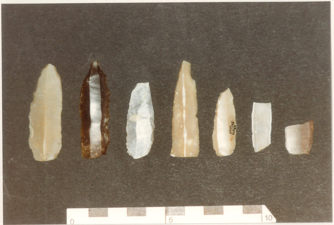
Photographie 9 : industrie lithique sur silex : lamelles, couche 7 (Néolithique moyen), Petit-Chasseur IV (Sion).