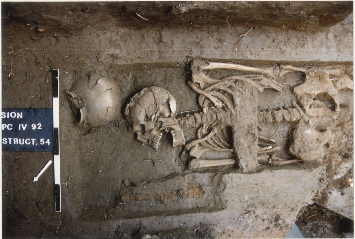
Photographie 3 : tombe La Tène (structure 54), Petit-Chasseur IV (Sion).