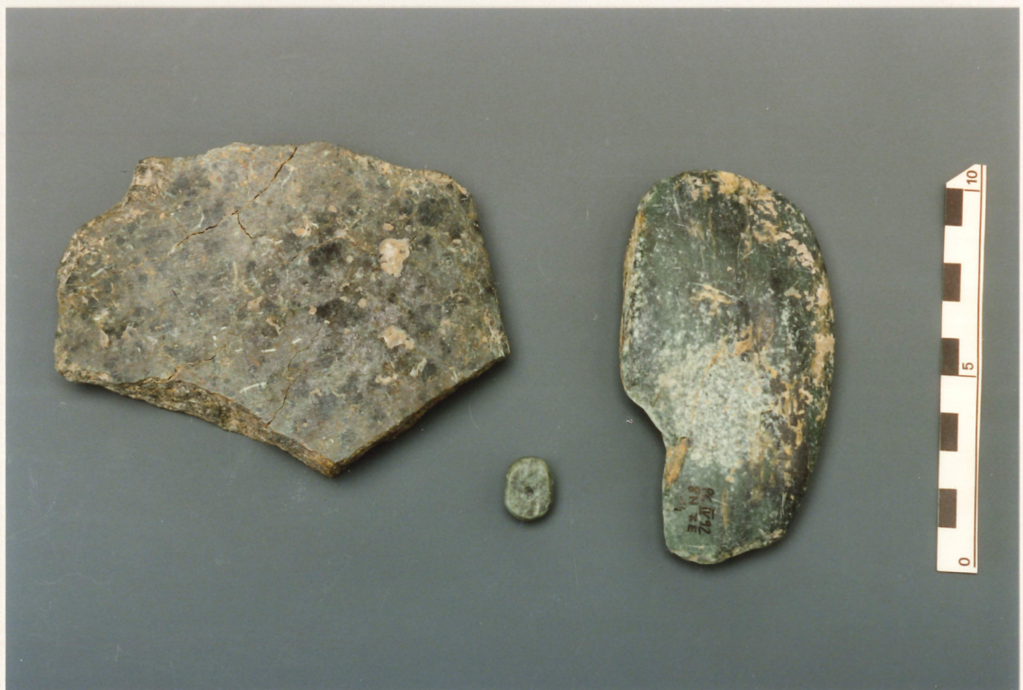
Photographie 8 : industrie lithique polie : fragments de pierre verte et ébauche de perle, couche 7 (Néolithique moyen), Petit-Chasseur IV (Sion).