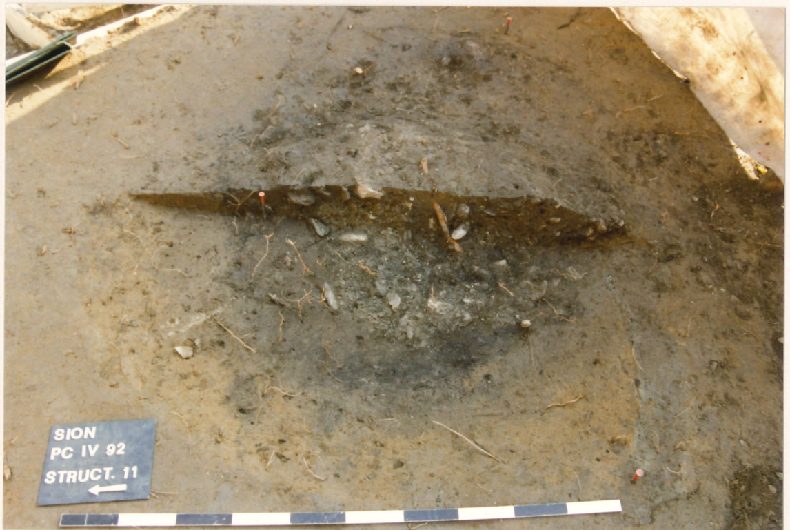
Photographie 6 : fosse (structure 11), couche 7 (Néolithique moyen), Petit-Chasseur IV (Sion).