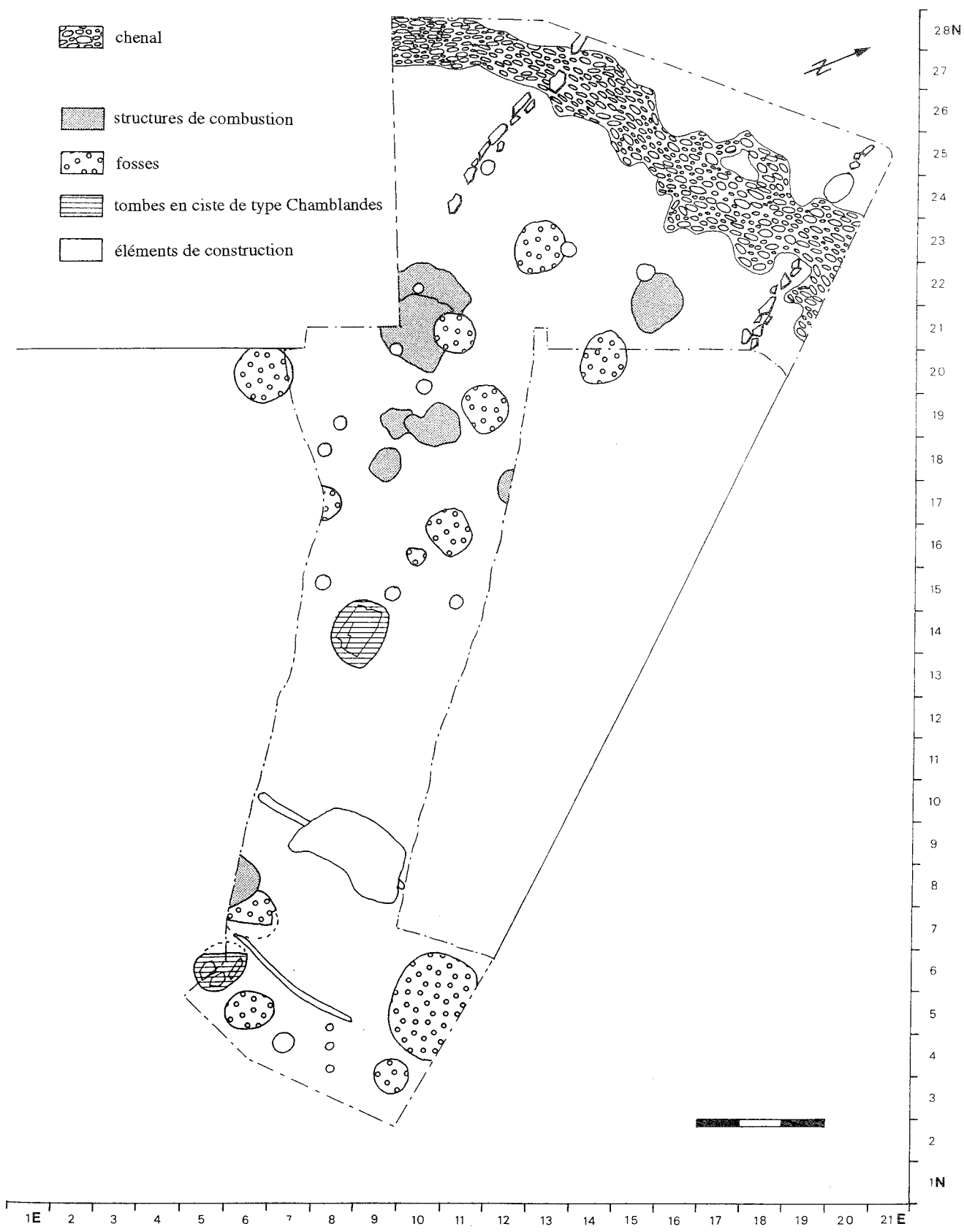
Figure 3 : plan de répartition des structures associées à la couche 7, niveau d'habitat du Néolithique moyen, Petit-Chasseur IV à Sion (Valais).