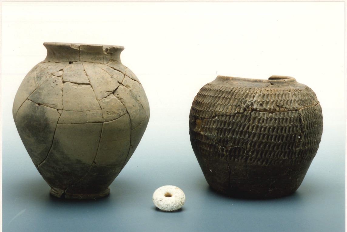
Photographie 4 : céramiques La Tène et anneau en calcaire provenant des structures 29 et 54, Petit-Chasseur IV (Sion).