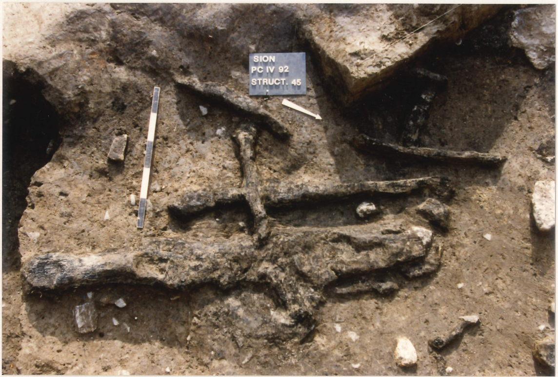
Photographie 7 : poutres carbonisées associées à la structure 45 (fosse), couche 7 (Néolithique moyen), Petit-Chasseur IV (Sion).