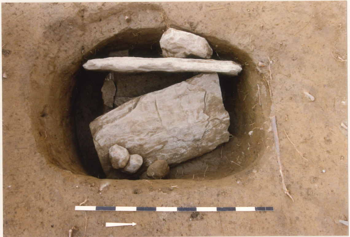
Photographie 5 : ciste de type Chamblandes (structure 16), couche 7 (Néolithique moyen), Petit-Chasseur IV (Sion).