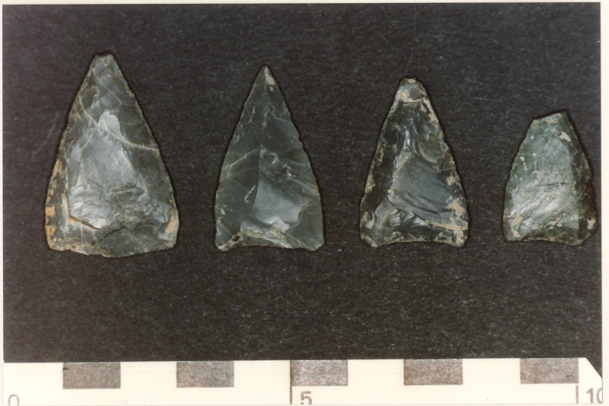
Photographie 10 : industrie lithique sur silex : pointes de flèches triangulaires, couche 7 (Néolithique moyen), Petit-Chasseur IV.