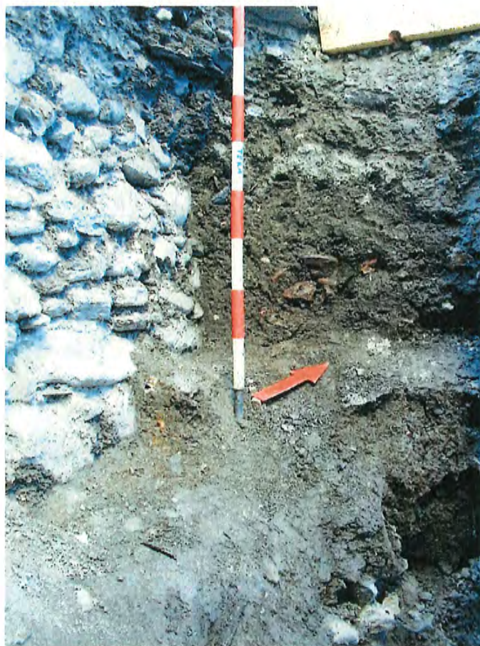
Fig. 5 niveau d'utilisation du mur (sous la flèche) et remblai plus récent