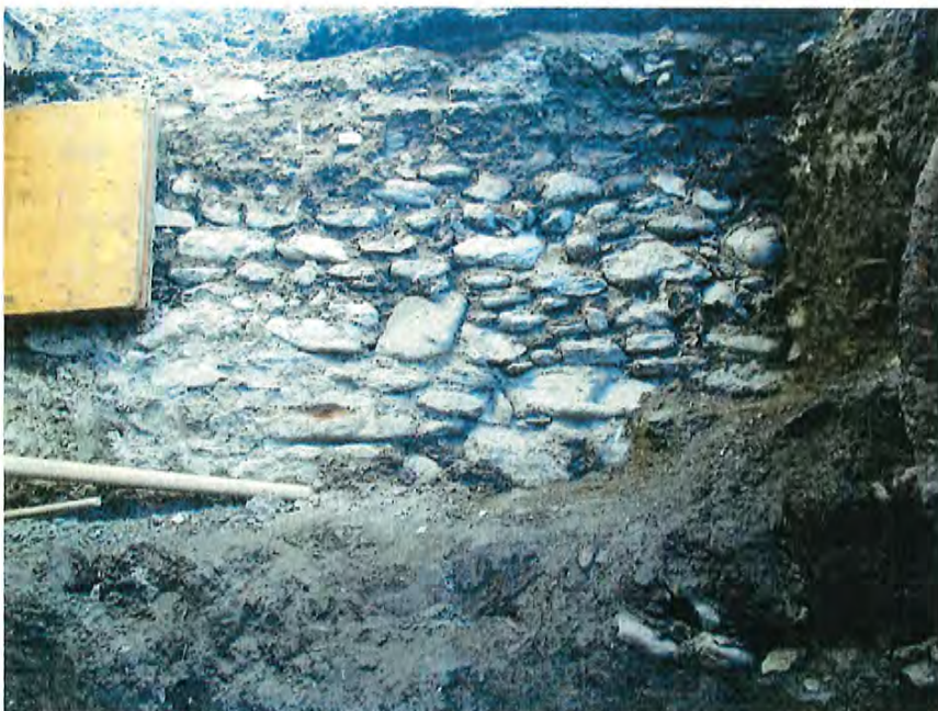
Fig. 3 détail de la maçonnerie à l'extrémité nord de la tranchée