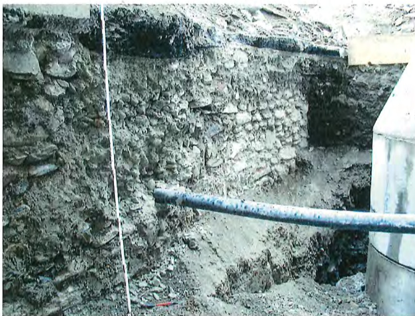
Fig. 2 vue générale de la face est du mur

L'élévation du mur est composée de petits et moyens galets (7-25cm) ; dans la partie basse apparaissent également quelques pierres de plus grande taille (25-30cm). Les assises sont assez irrégulières, les pierres posées à plat, le mortier de construction grossièrement raclé en surface (fig. 2-5). Deux assises de fondation composées de grosses pierres (25-30cm) sont clairement visibles au sud, avec un petit ressaut d'environ 5cm par rapport au parement de l'élévation.