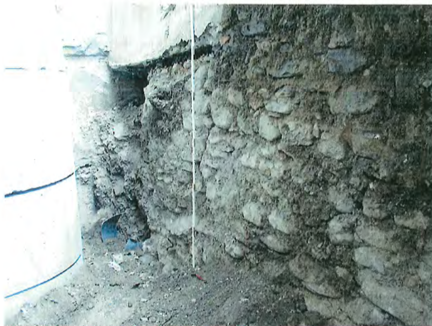
Fig. 4 détail à l'extrémité sud du mur