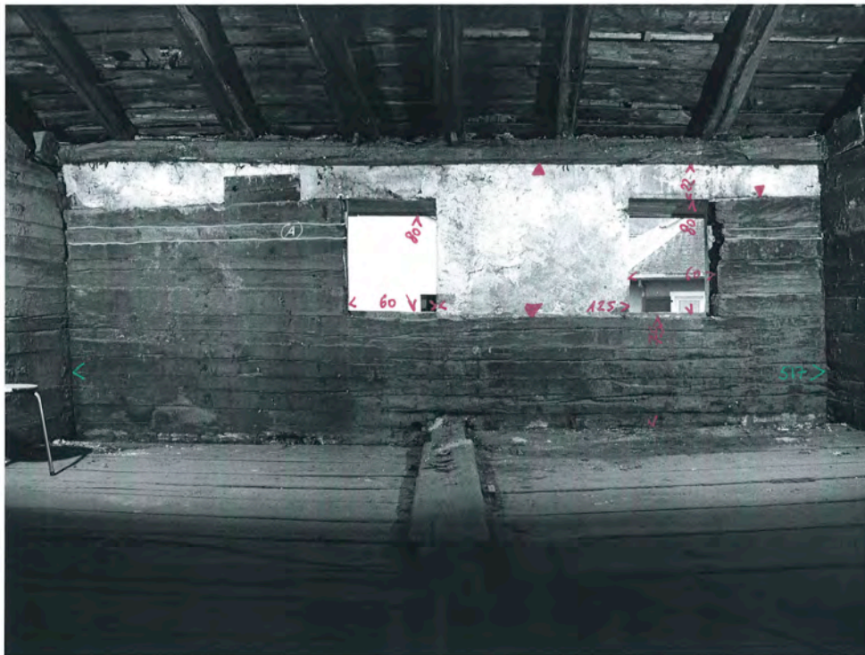
Bramois 2010, rue du Vieux Village 36 3e étage, salle, vue ouest

A : panneau plafond intérieur aux fenêtres