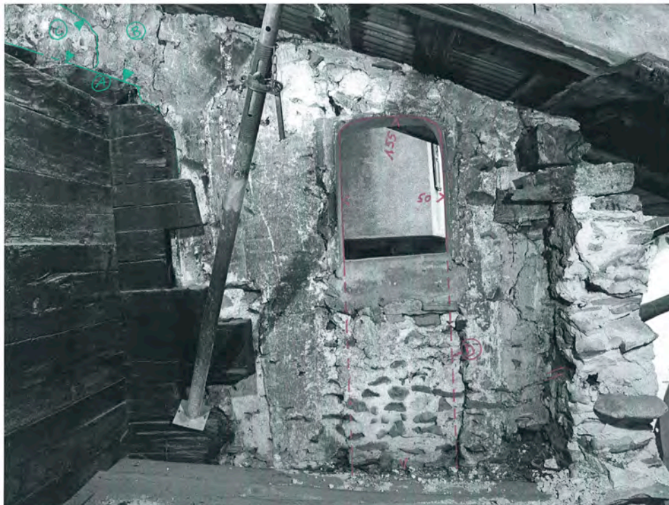
Bramois 2010, rue du Vieux Village 36 3e étage, chambre, vue nord