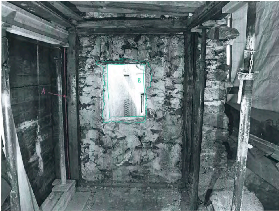
Bramois 2010, rue du Vieux Village 36 2e étage, chambre, cue nord

A = front vertical de la façade N l'ubois : également ajouté B = fenêtre percée - Rivoltée de pierres