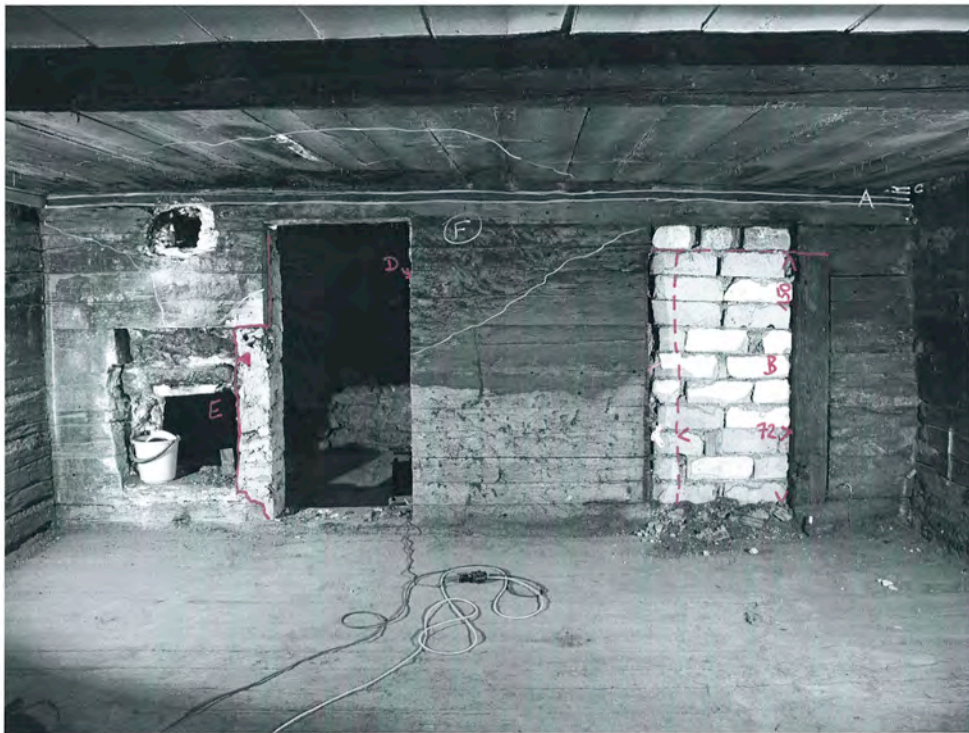
Bramois 2010, rue du Vieux Village 36 2e étage, salle, vue sud