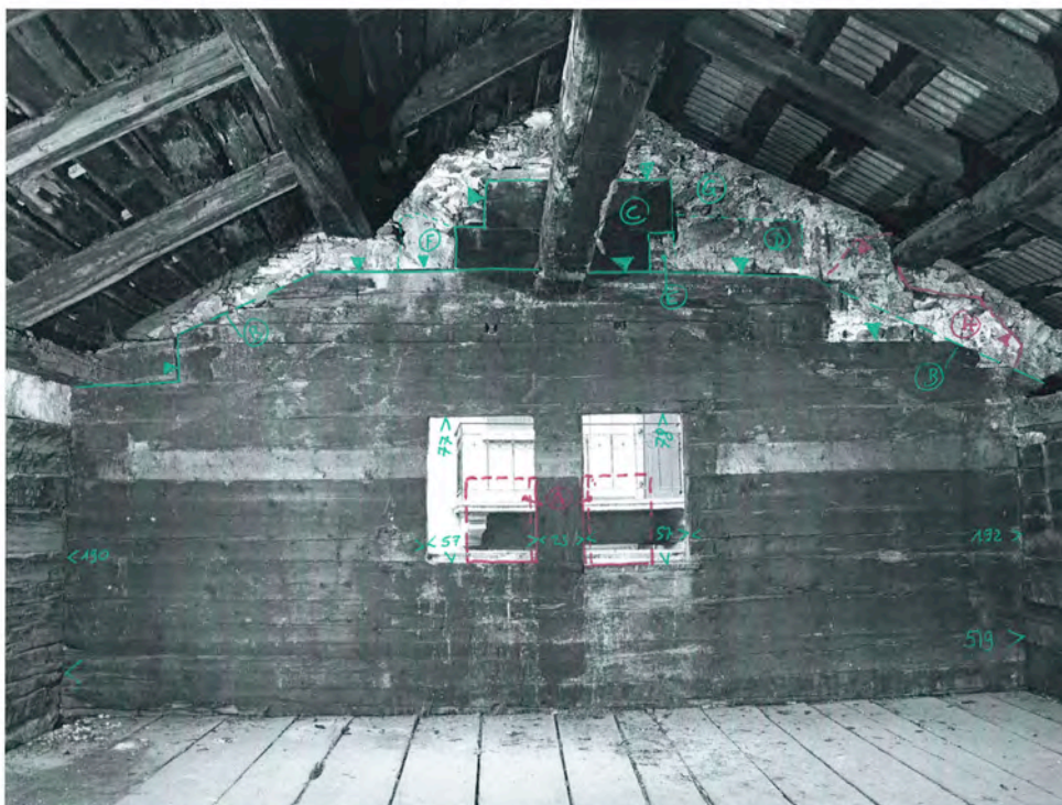
Bramois 2010, rue du Vieux Village 36 3e étage, salle, vue nord