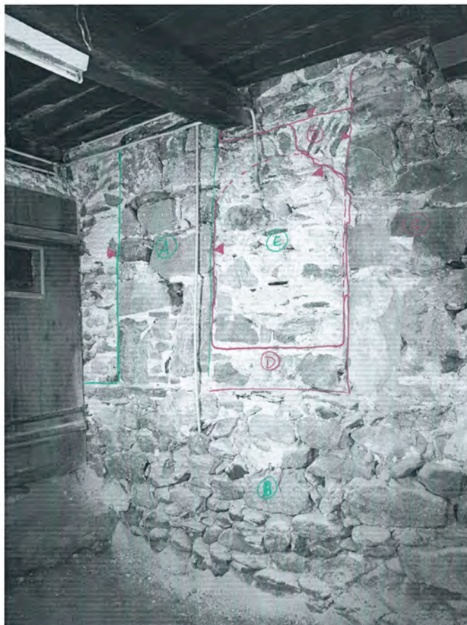
Bramois 2010, rue du Vieux Village 36 Cave intermédiaire, vue nord

A = pilier en sautoir / bas (vent ?) ≡ entité isolée B = gale (lié avec A ?) C = front mur, lié avec B ou A ? (avec C et A support... ?) D = bande (entre A et C) premier front / suite sous arc E = bande de D