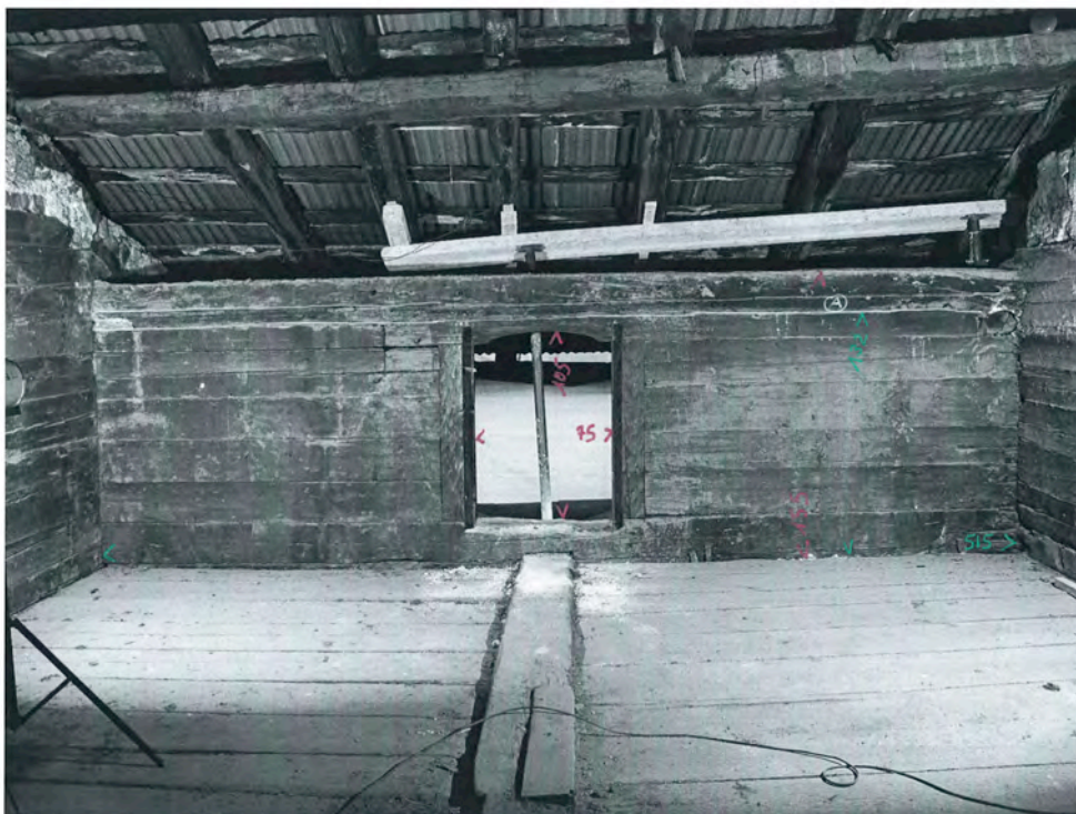
Bramois 2010, rue du Vieux Village 36 3e étage, salle, vue est