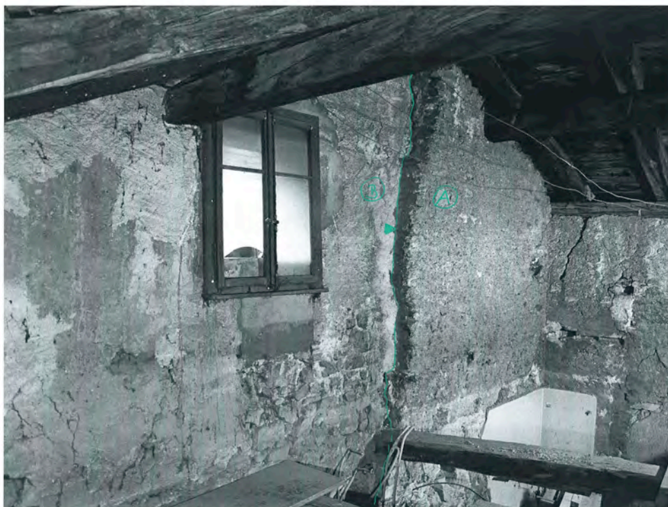
Bramois 2010, rue du Vieux Village 36 3e étage, cuisine, vue sud-ouest