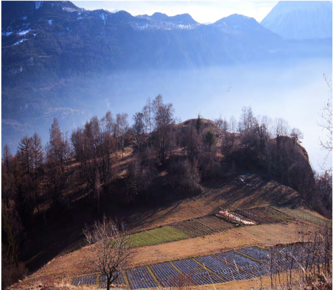
Vue du site du Scex Rouge depuis Chiboz d'en Bas. Au premier plan l'enselleure.