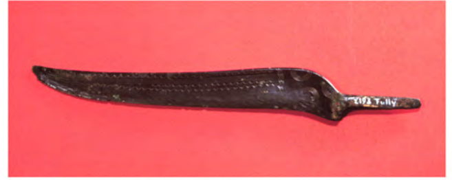
Couteau en bronze de la fin de l'âge du Bronze (1000-900 av. J.-C. / Hallstatt B1) provenant de Mazembroz. (longueur : 18 cm) Musée cantonal d'archéologie, Sion.