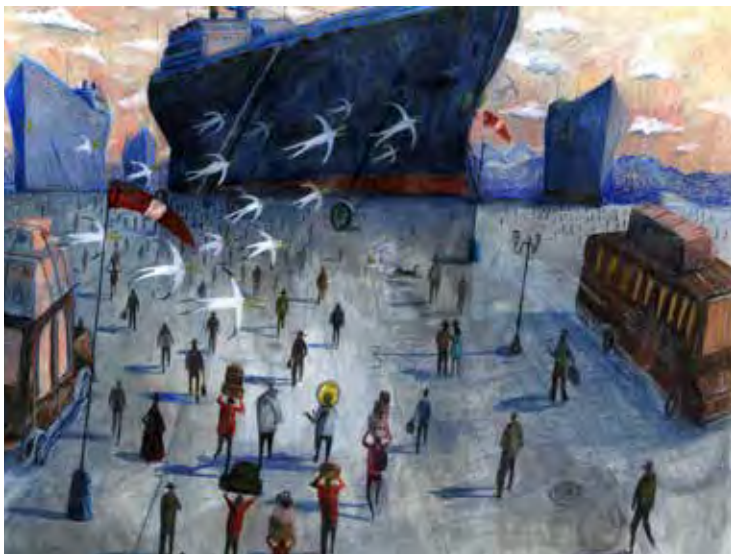
Alumni Dexter Maurer