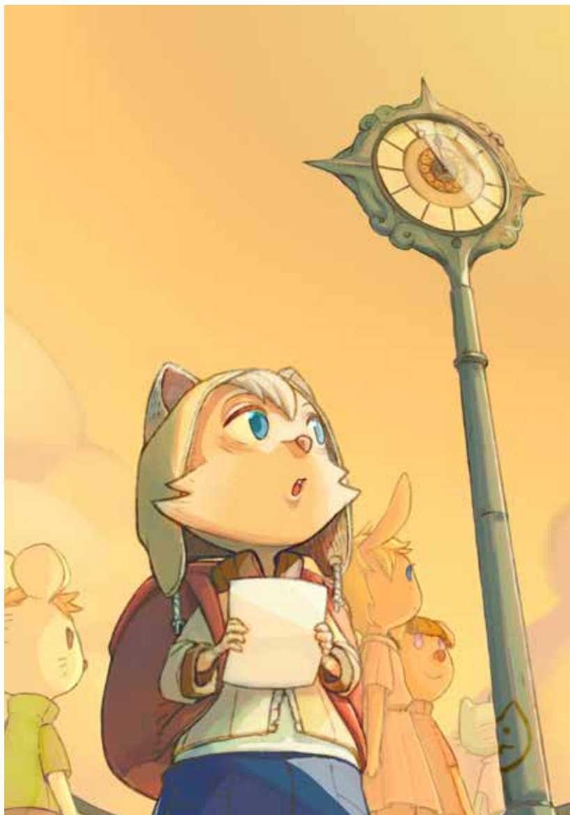
Aline Schroeter, travail de diplôme