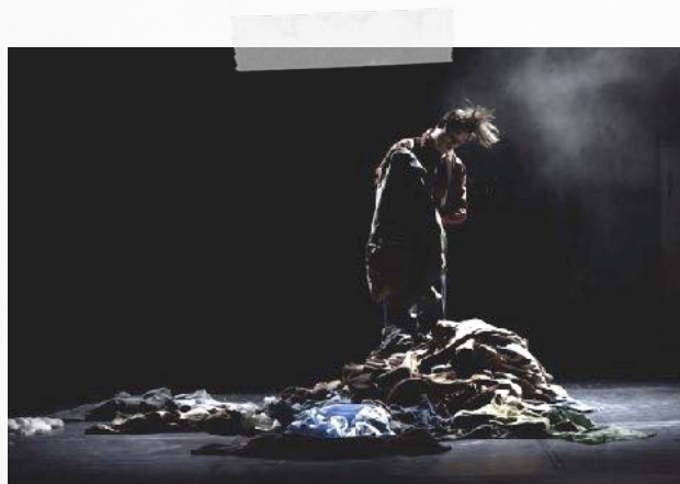
« aparté · de la poésie en apesanteur. » le nouvelliste du 9.06.2012