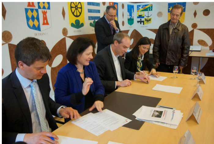
Fig. 2. Signature du contrat de dépôt des archives de la Commune et de la Bourgeoisie de Saint-Maurice (Photo : Line Dayer, Service de la culture).

trésors de ce fonds d'archives prestigieux du point de vue de son volume (944 parchemins, 15 rouleaux de parchemin, 167 registres et 4244 documents conservés sur support papier pour un total de 32 ml) et de la période qu'il couvre (1265 à 1957).