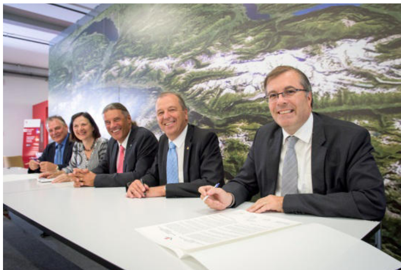
Fig. 6. Conférence de presse en présence du Conseil d'Etat in corpore

Au-delà de ce premier objectif, l'exposition voulait aussi replacer les événements de 1815 dans leur contexte historique et, avant tout, les situer dans le fil de la longue histoire valaisanne, tout en questionnant les évidences et en remettant en question certaines idées reçues. Le Valais était-il destiné à être suisse ? Quel était son statut et avait-il des relations diplomatiques avant le XIX e siècle ? En 1815, la Suisse a-t-elle vraiment eu un « coup de cœur pour le Valais » ? Le Valais aurait-il pu être italien, français ou... indépendant ? Telles ont été les questions posées par l'exposition Passez à l'Acte ! qui, en présentant des documents d'archives accompagnés de plusieurs objets contemporains, montrait la complexité de l'histoire valaisanne.