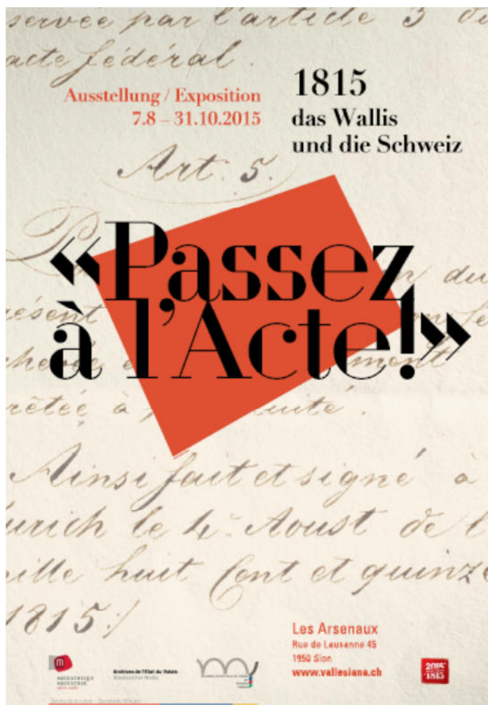
Fig. 7. Affiche de l'exposition Passez à l'Acte ! 1815, das Wallis und die Schweiz (© Service de la culture ; conception : Matthieu Berthod)

L'exposition Passez à l'Acte! 1815, das Wallis und die Schweiz s'est déroulée aux Arsenaux du 7 août au 31 octobre 2015 ; elle a suivi une intense phase de préparation, qui a déjà débuté en novembre 2014. Elle a été accompagnée par un riche programme d'actions de médiation culturelle (visite commentée, ateliers pour classes, conférences) et une exposition virtuelle accessible en ligne ( https://www.vs.ch/web/exposition-virtuelle/home ).